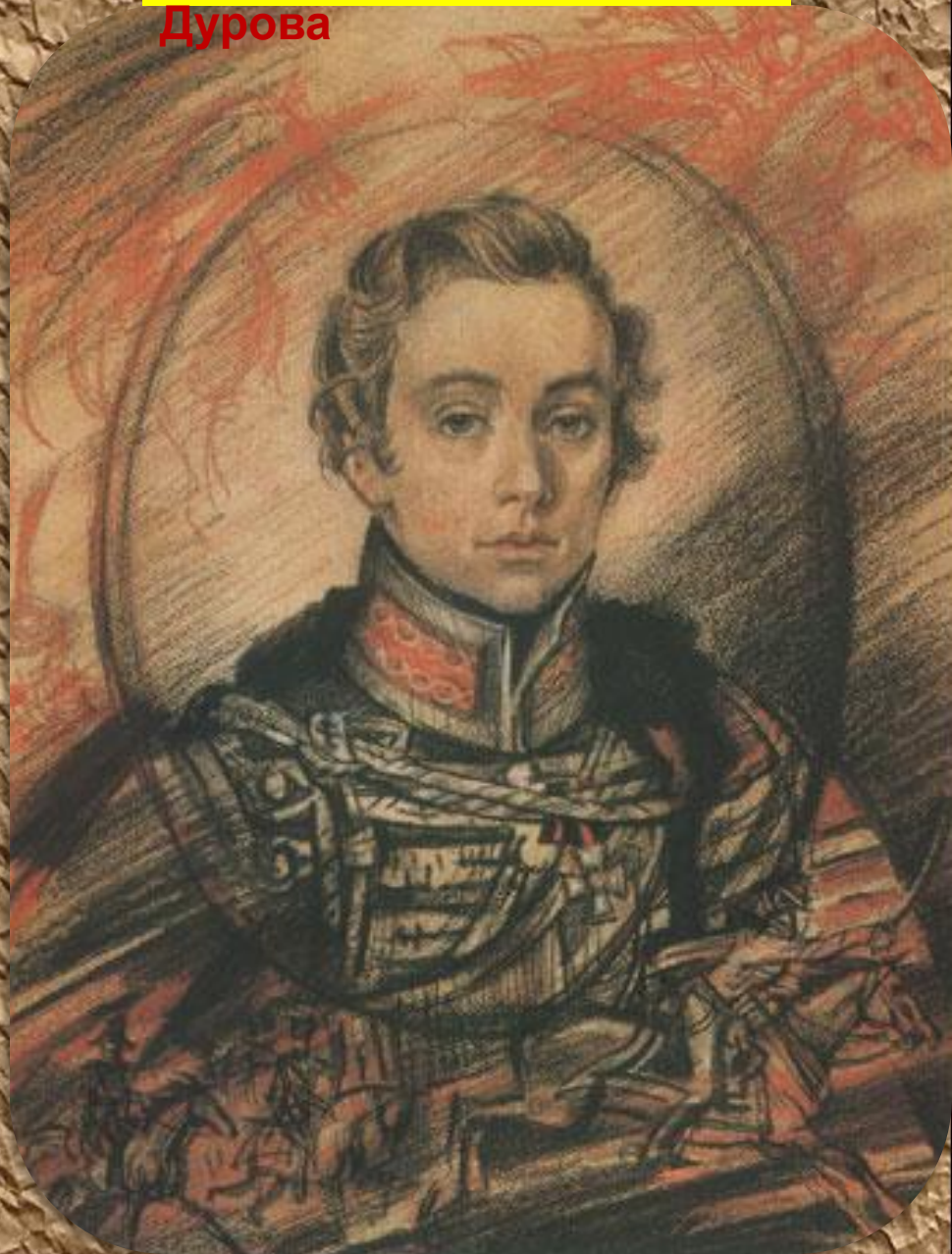
Надежда Андреевна Дурова