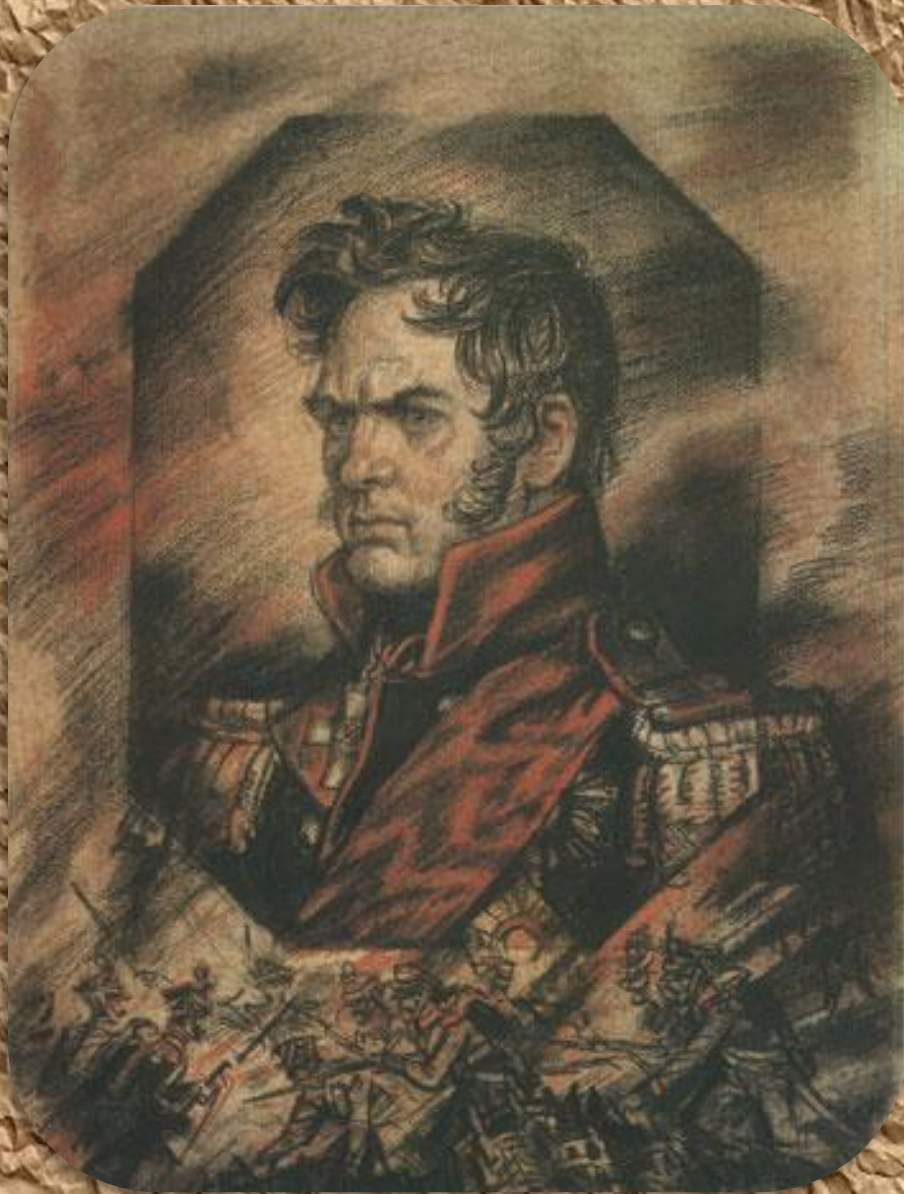
Алексей Петрович Ермолов