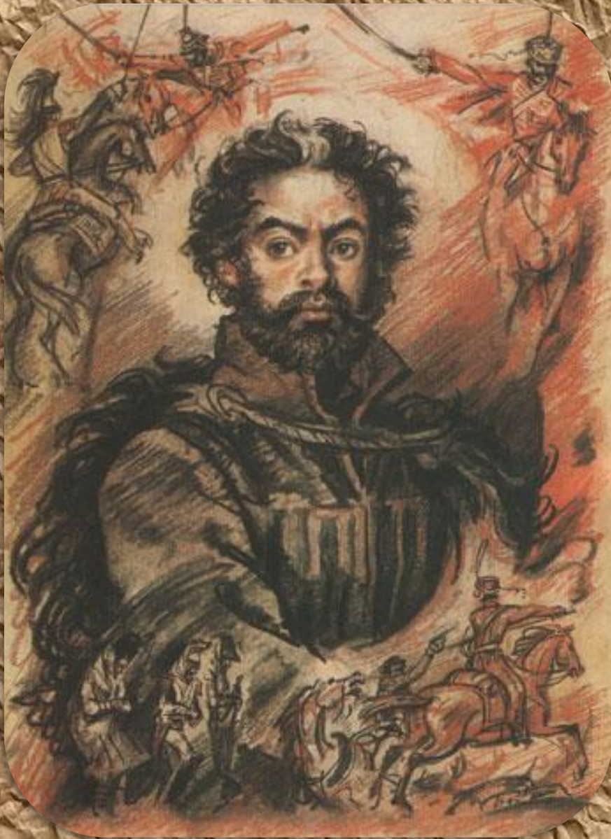
Денис Васильевич Давыдов