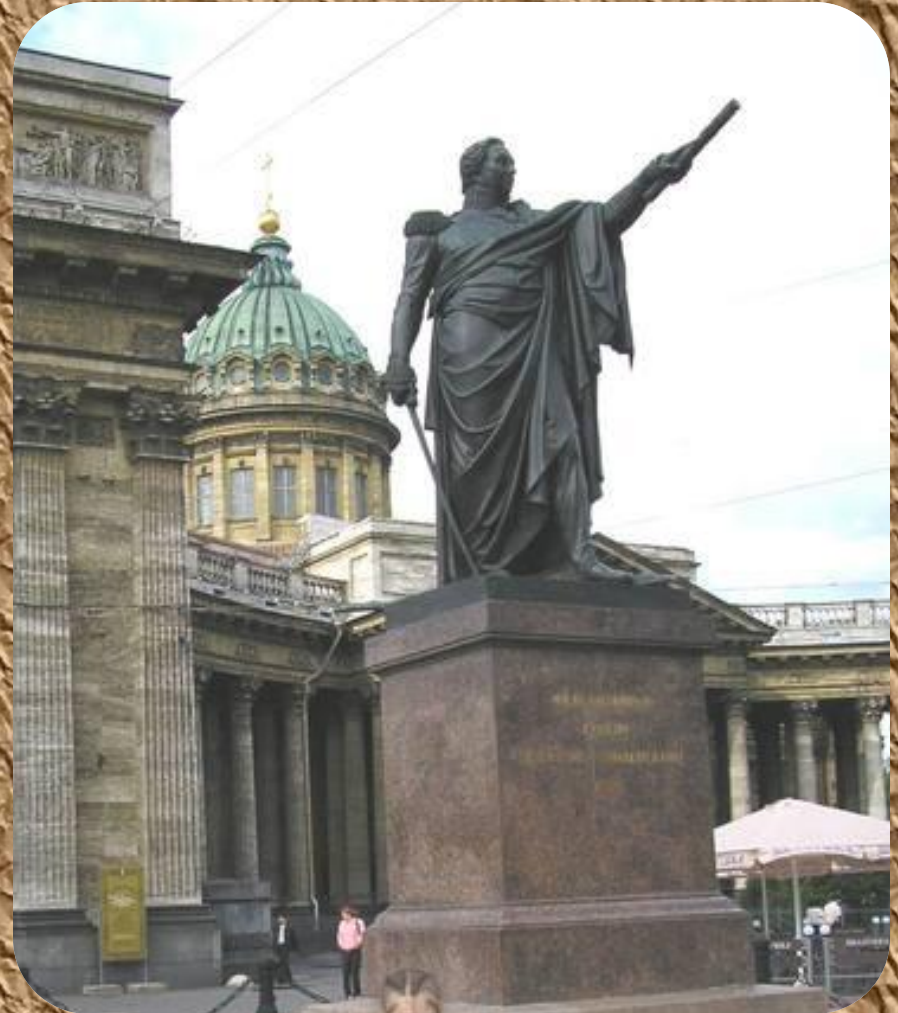
Памятник Кутузову около Казанского собора.