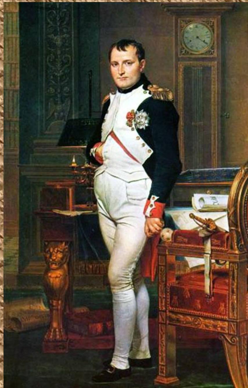
Ж.Л. Давид. Наполеон в своём

12 июня 1812 года громадная французская армия вторглась в Россию. Началась Отечественная война русского народа против захватчиков.