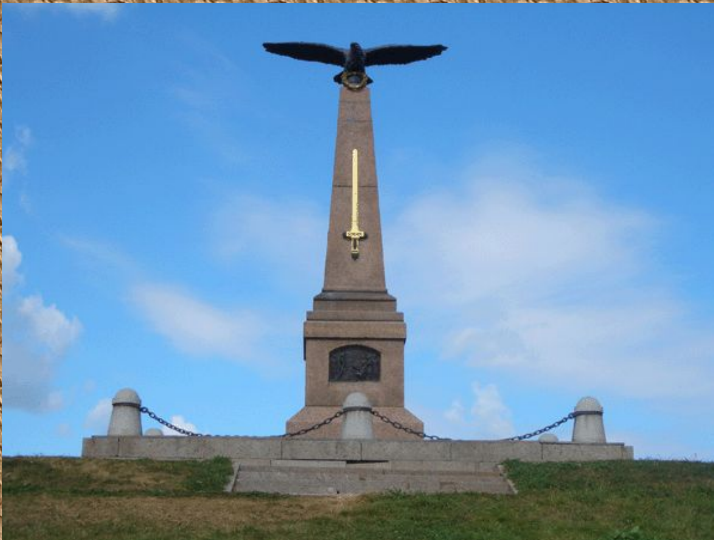
Памятник русским воинам на Бородинском поле.