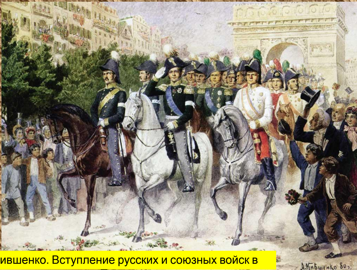
А. Кившенко. Вступление русских и союзных войск в Париж.

В 1814 году русские войска и их союзники вошли в Париж. Так закончилась попытка поставить Россию на колени.