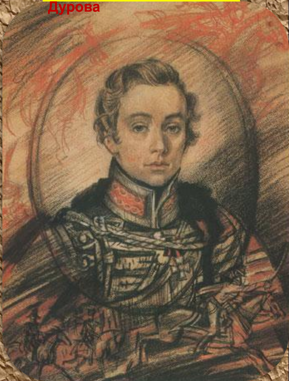
Надежда Андреевна Дурова