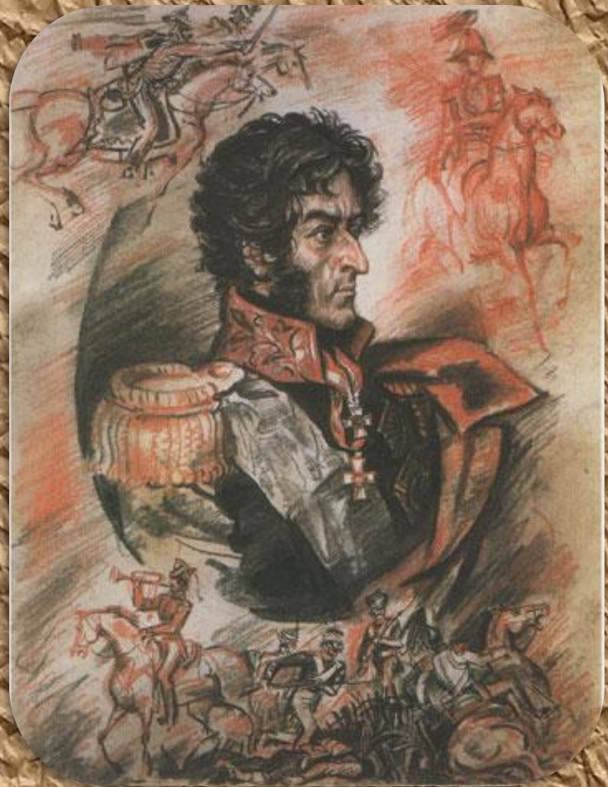
Пётр Иванович Багратион