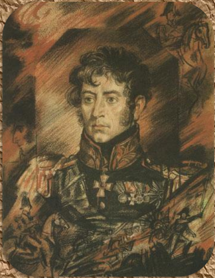
Михаил Андреевич Милорадович