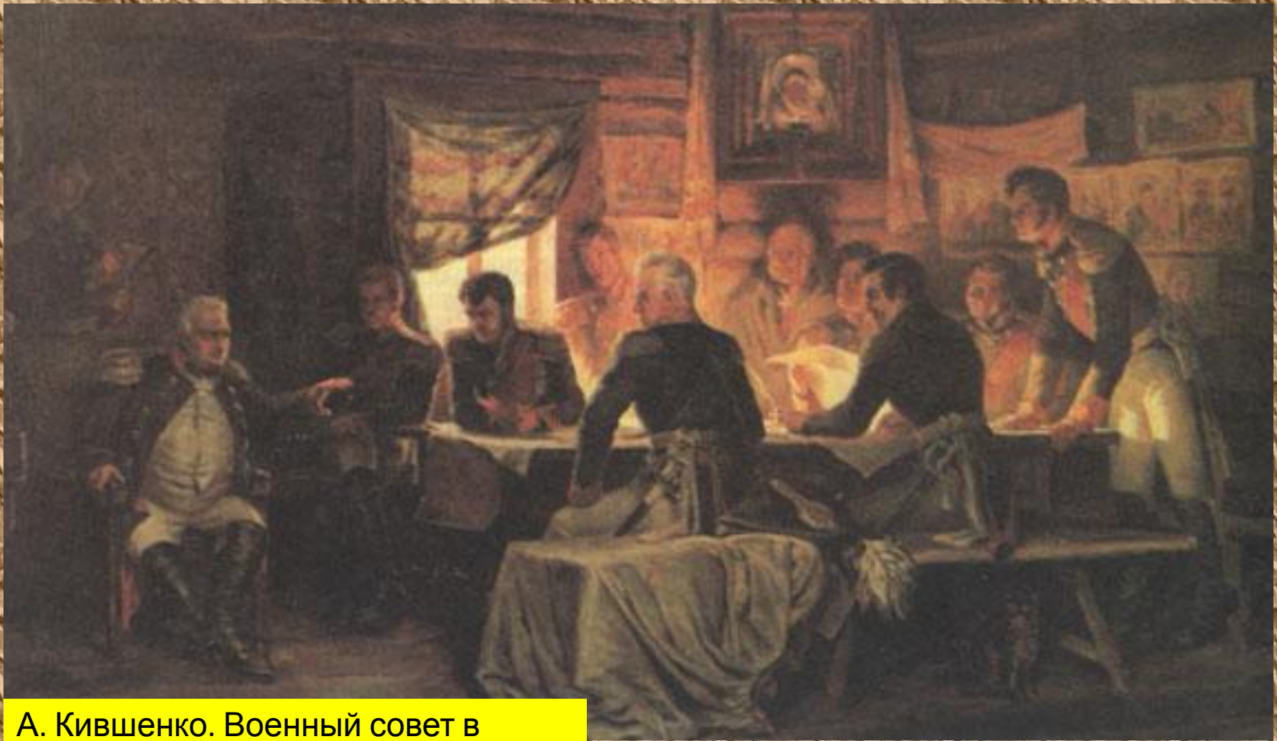
А. Кившенко. Военный совет в