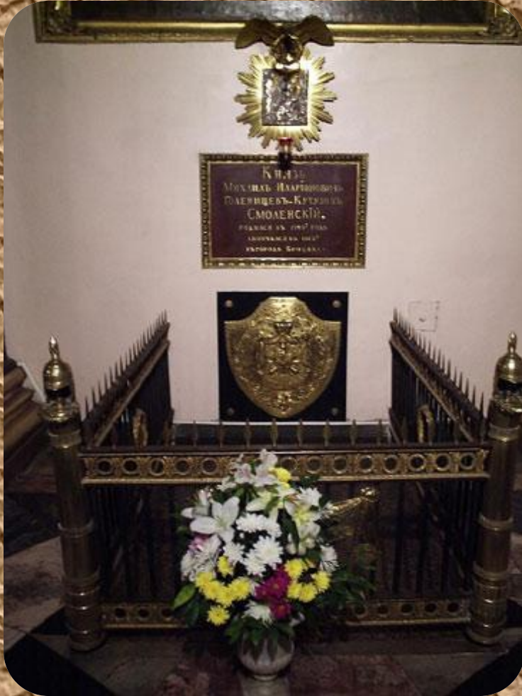
Могила М. И. Кутузова в Казанском соборе.