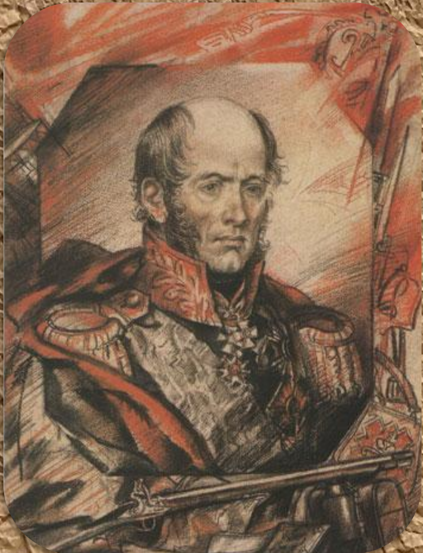
Михаил Богданович Барклай де Толли