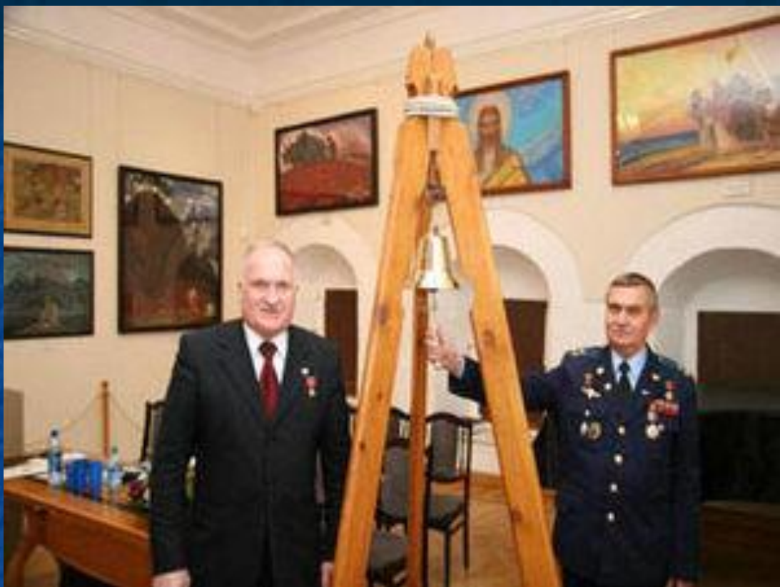
На фото: лётчики-космонавты В. М. Афанасьев и А.Н. Березовой

В России впервые акция «Колокол Мира в День Земли» была проведена в 1998 году в Москве, её организаторами стали Международный центр-музей имени Н. К. Рериха, Международный гуманитарный фонд «Знание», Федерация космонавтики России, Международная Ассоциация фондов Мира.