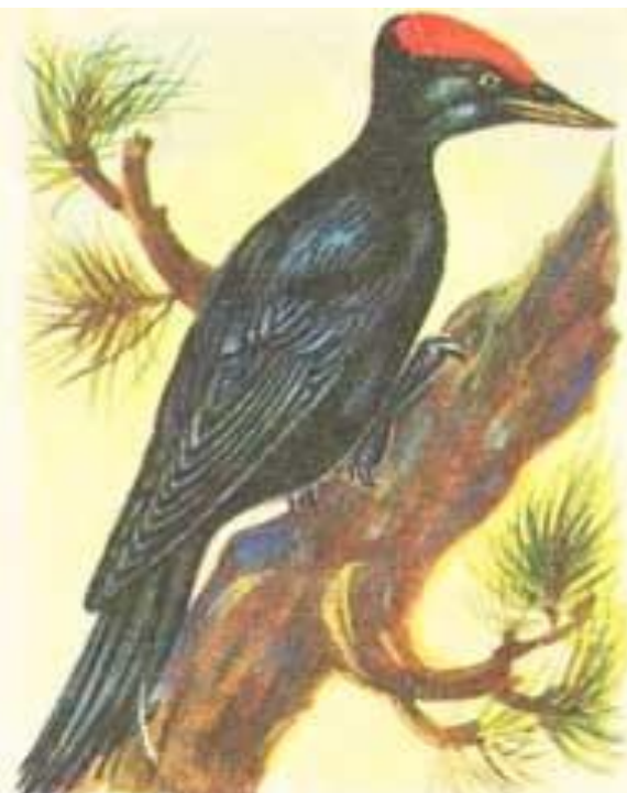
чёрный дятел (желна)