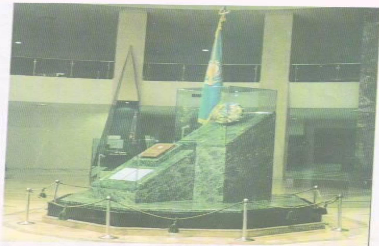
Еліміздің Туы. Елтаңбасы. Әнұраны. Конституциясы қойылған орын. ҚР Президенттік мәдениет орталығы.

1992 жылы 4-маусымда жаңа мемлекеттік рәміздер Елтаңба, Ту, Гимн бекітілді.