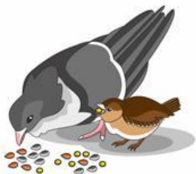
Голуби и воробьи