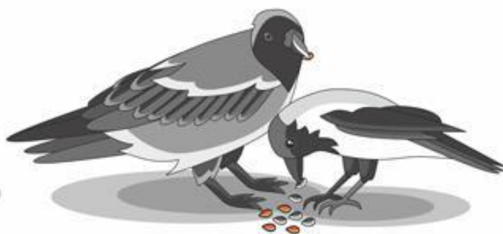
Вороны и сороки