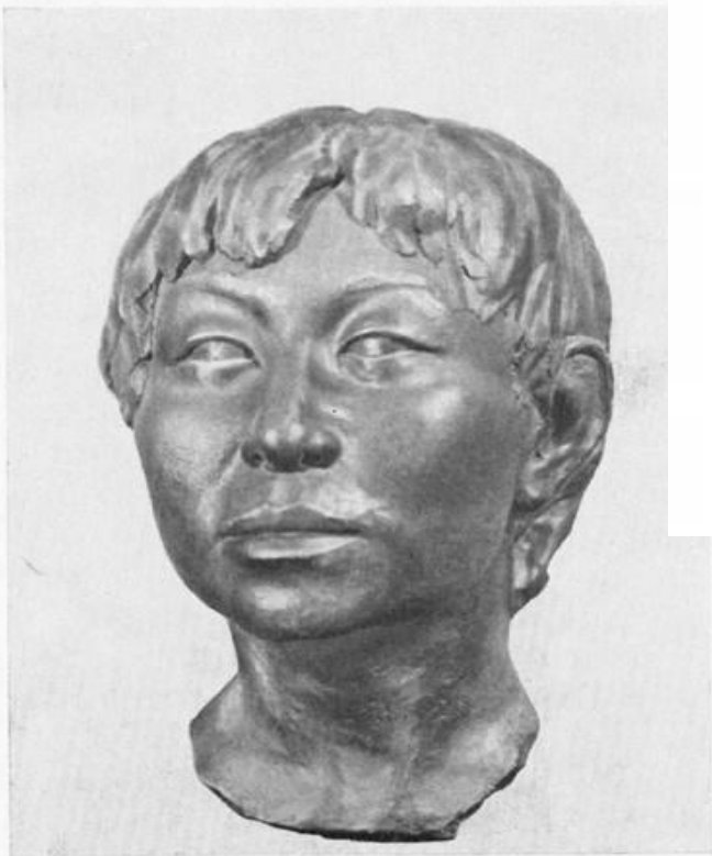
ТАБЛИЦА VIII СКУЛЬПТУРНАЯ РЕКОНСТРУКЦИЯ ПО ЧЕРЕПУ ЖЕНЩИНЫ ИЗ МОГИЛЬНИКА ФОФАНОВО АВТОР Г. В. ЛЕБЕДИНСКАЯ

Скульптурная реконструкция по черепу женщины из могильника Фофаново.