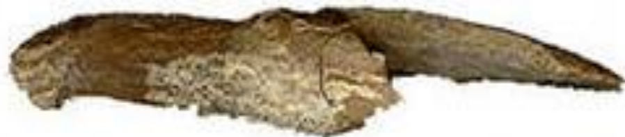
Инструменты из могильника Фофаново

Скульптурная реконструкция по черепу женщины из могильника Фофаново.