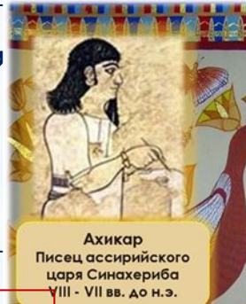
Ахикар Писец ассирийского царя Синахериба VIII - VII вв. до н.э.

«Поступай по отношению к другому так, как ты хочешь, чтобы поступали с тобой».