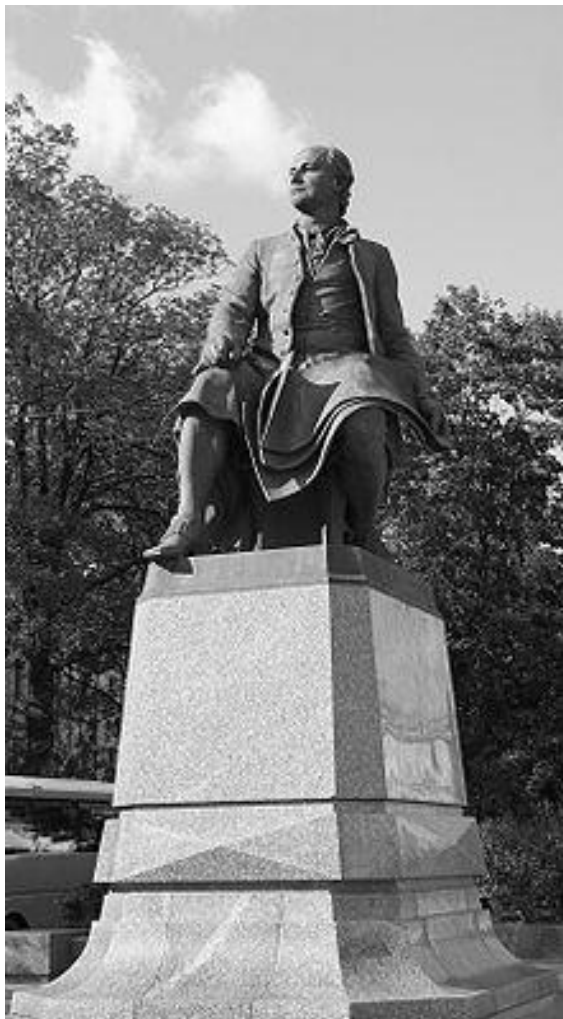
Памятник М.В. Ломоносову в Санкт-Петербурге