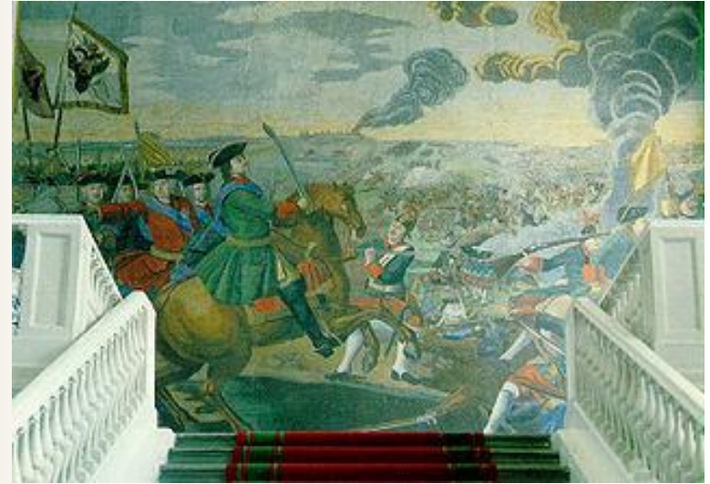
«Полтавская баталия» мозаика в здании Академии Наук в Санкт-Петербурге