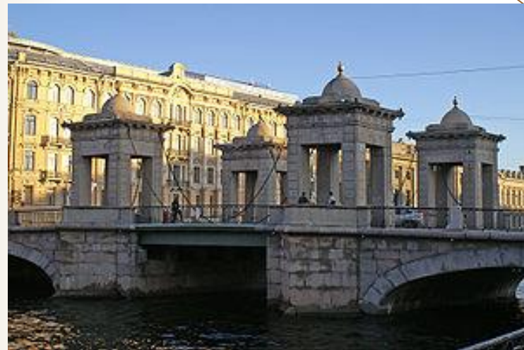
Мост Ломоносова через Фонтанку в Санкт-Петербурге