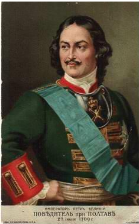
ИМПЕРАТОРЪ ПЕТРЪ ВЕЛИКІЙ ПОБѢДИТЕЛЬ при ПОЛТАВѢ 27. Іюли 1709 г.