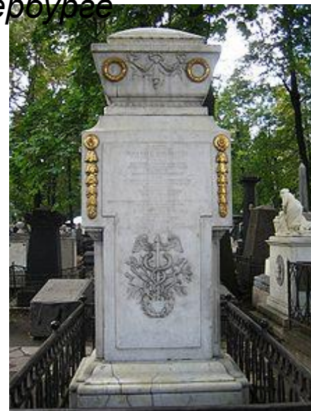
Могила Ломоносова в Александро-Невской лавре