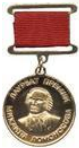
Большая и малая золотые медали