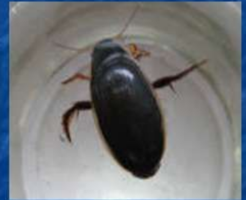
Жук - плавунец