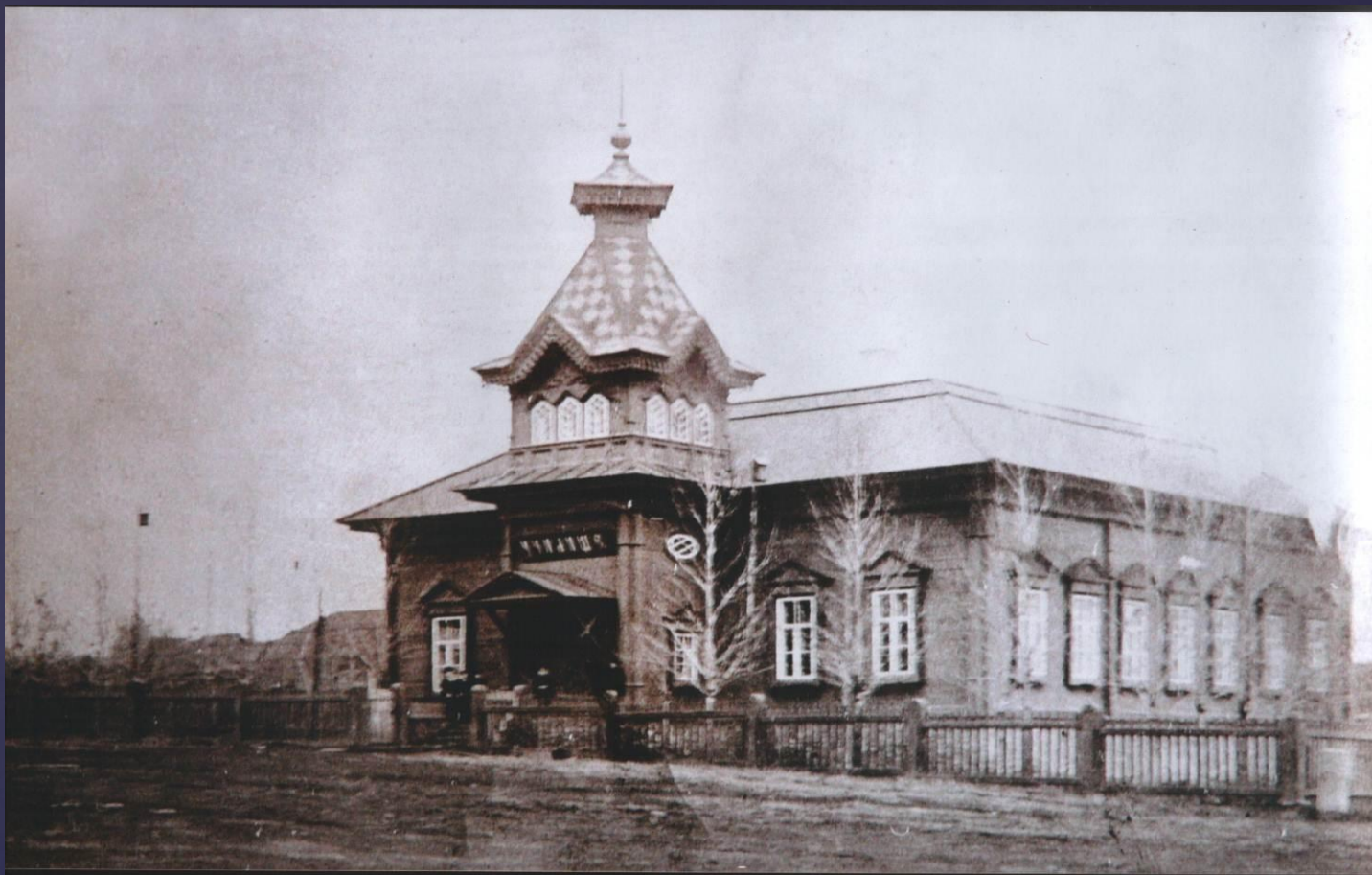
Училище в д.Кокшан