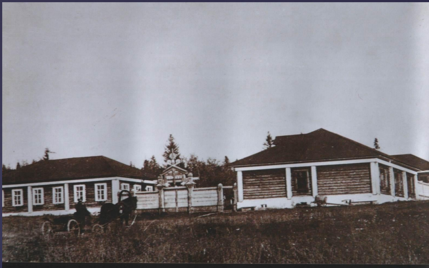
Больница в д.Кокшан