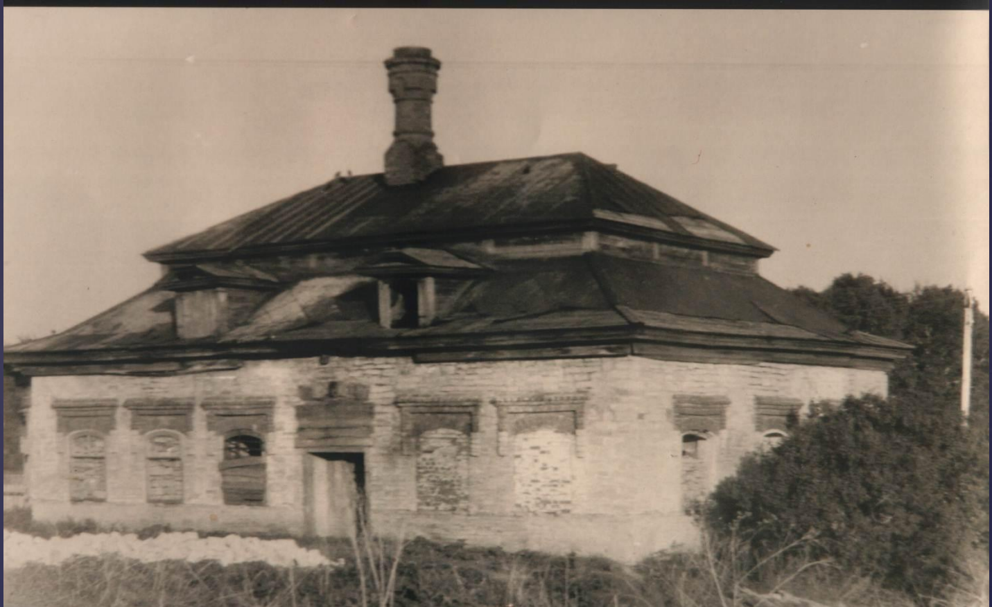
Церковно-приходская школа в д.Ильнеть