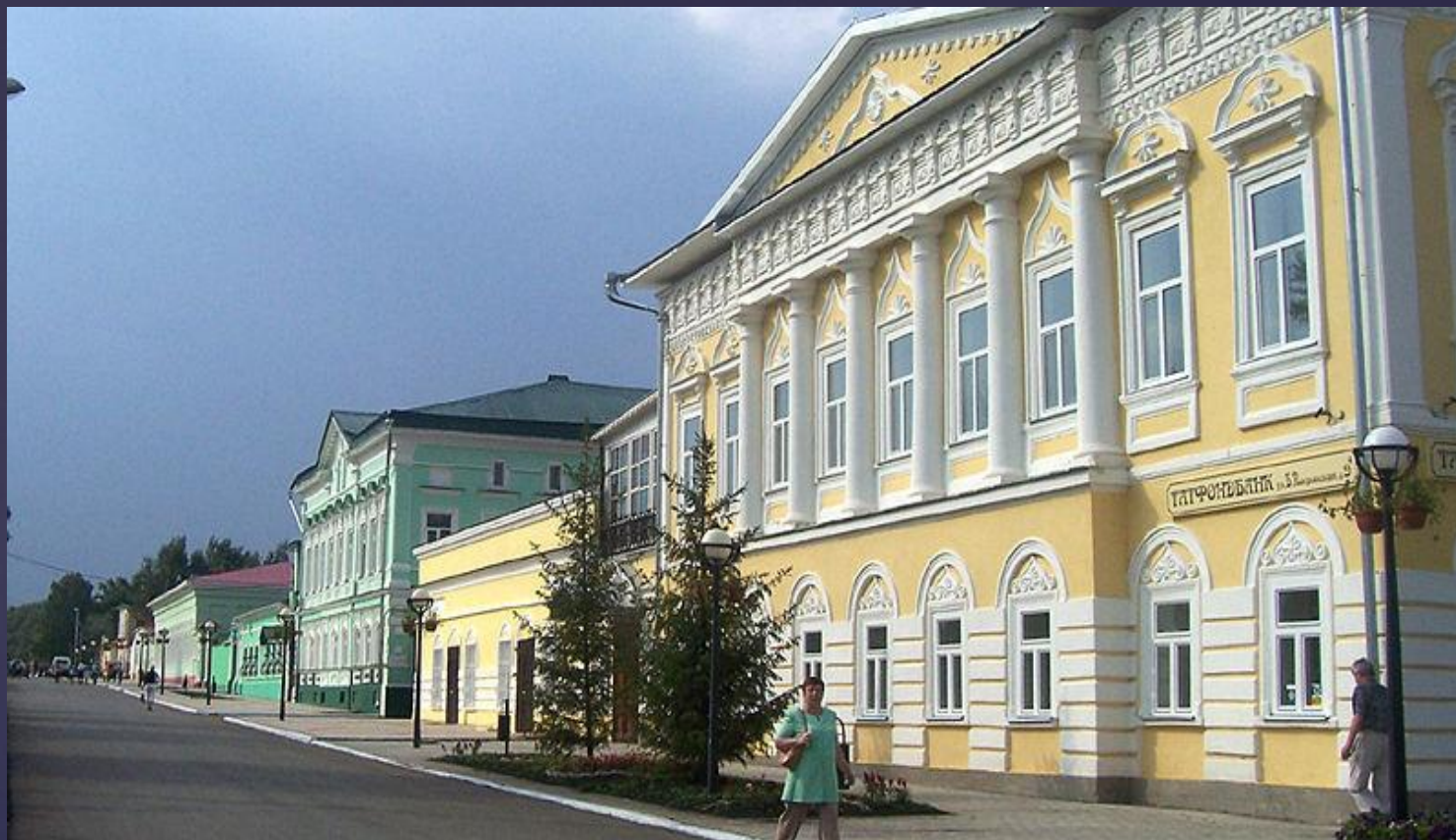
Здание гимназии в Елабуге