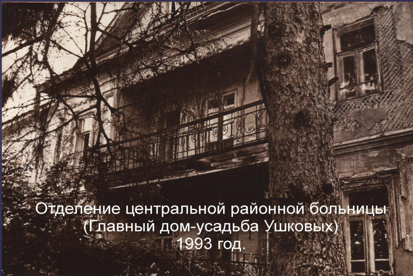
Отделение центральной районной больницы (Главный дом-усадыба Ушковых) 1993 год.