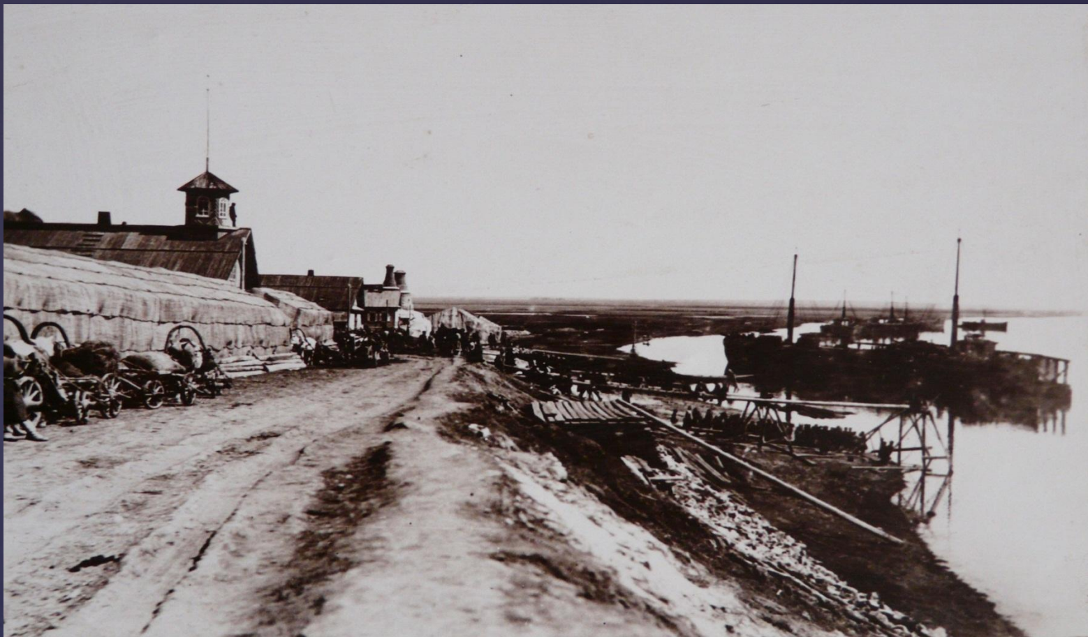
Пристань Тихие горы