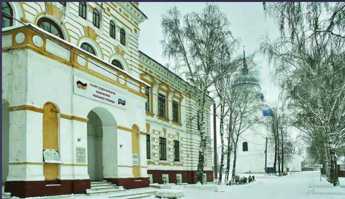
Здание реального училища в Елабуге