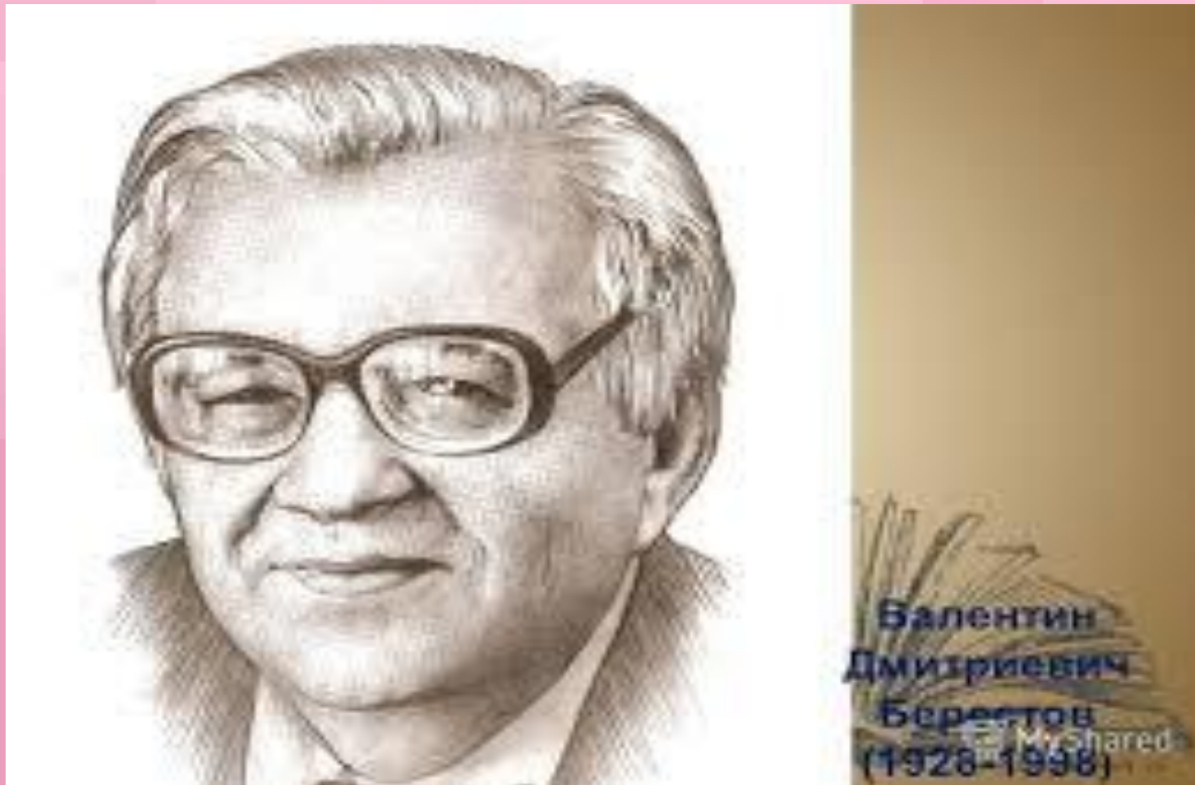
Валентин Дмитриевич Берестов