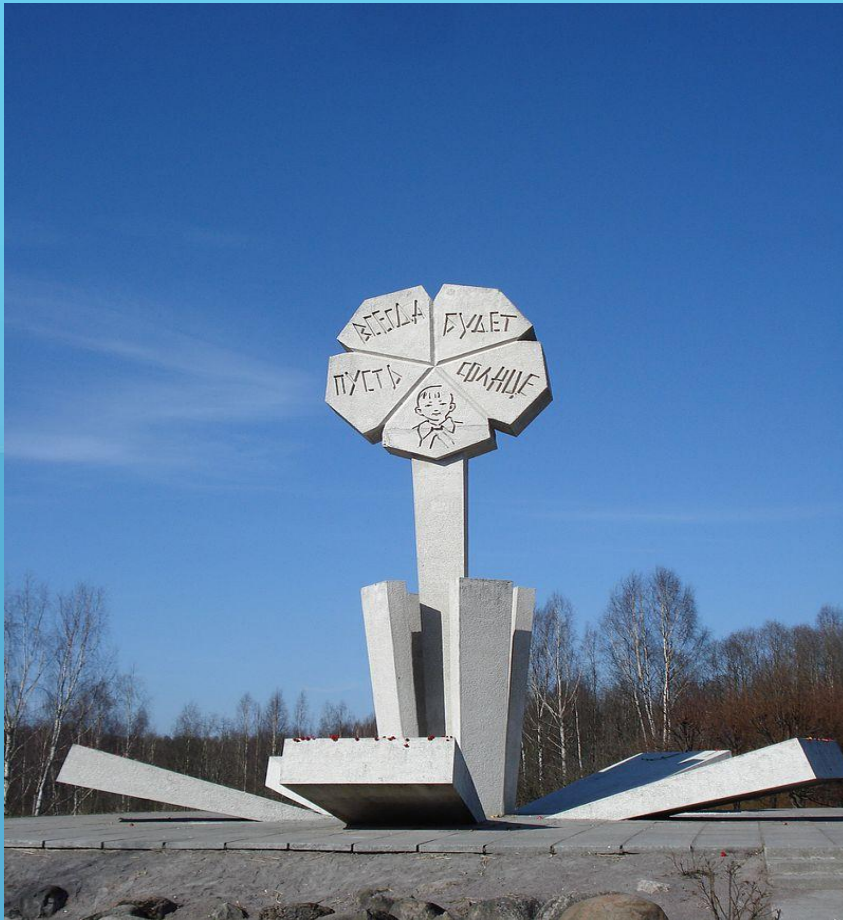
Слова из песни на мемориале « Цветок жизни »