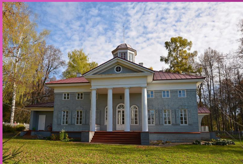
Музей-усадьба А. С. Пушкина в Захарово.