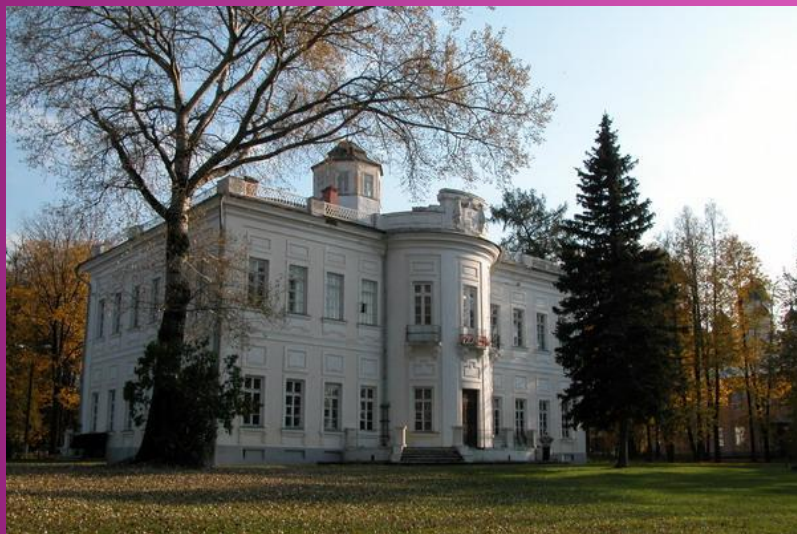
Музей—заповедник А. С. Пушкина в больших Вяземах.

ПОЭТИЧЕСКОЙ РОДИНОЙ ПУШКИНА НАЗЫВАЮТ ПОДМОСКОВНЫЕ УСАДЬБЫ ЗАХАРОВО И ВЯЗЕМЫ – ВЕДЬ ЗДЕСЬ ПРОШЛО ЕГО ДЕТСТВО. ИМЕННО В ЭТИХ МЕСТАХ ФОРМИРОВАЛИСЬ ЕГО ВЗГЛЯДЫ НА ЖИЗНЬ, ЗДЕСЬ ОН НАЧАЛ ПИСАТЬ СВОИ ПЕРВЫЕ СТИХИ, ЗДЕСЬ ОН СКЛАДЫВАЛСЯ КАК ВЕЛИКИЙ НАЦИОНАЛЬНЫЙ ПОЭТ.