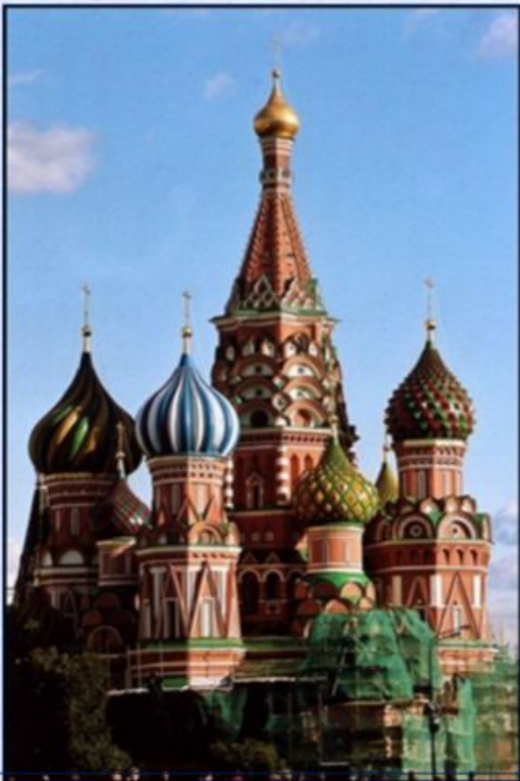
Купола храма Василия Блаженного на Красной площади в Москве.

Луковицевидные купола. Основание купола уже его середины, верхушка оттянута, поверхность куполов неровная: ребристая или ячеистая.