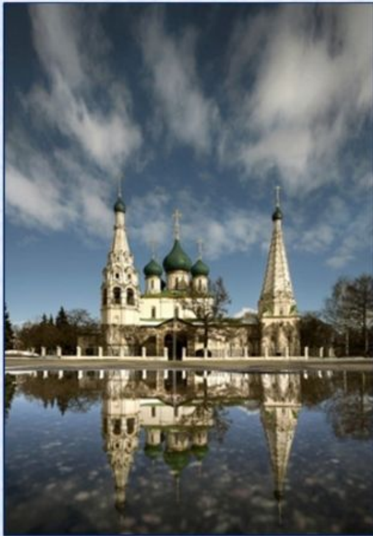
Храм в Ярославле с крашеными луковичевидной формы куполами.