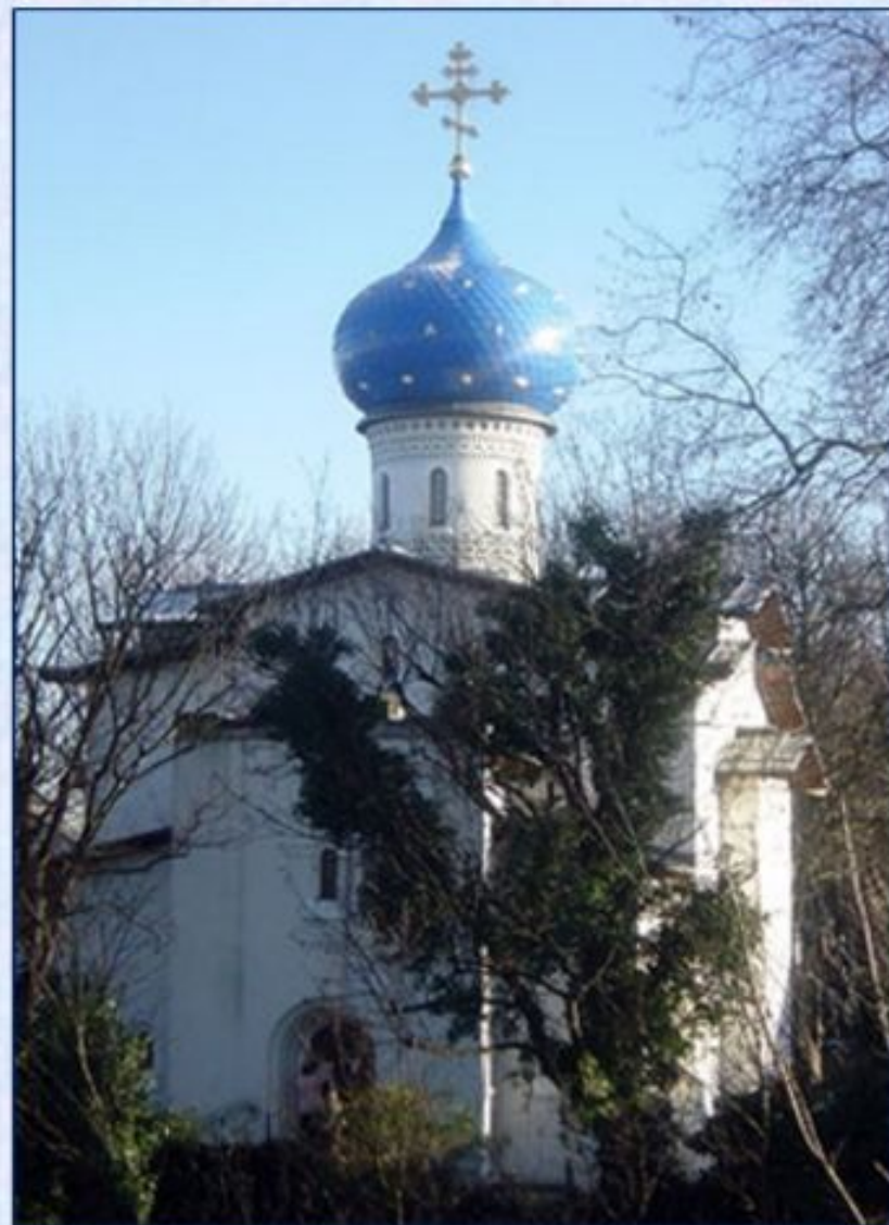
Православная церковь в Лондоне.

Луковицевидные купола. Основание купола уже его середины, верхушка оттянута, поверхность куполов неровная: ребристая или ячеистая.