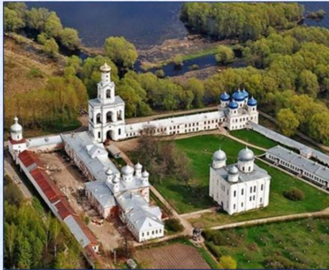
Юрьевский монастырь в Новгородской области. Все купола грушевидной формы, но чуть сплюснутые. Храм на звоннице позолоченный, остальные нет.