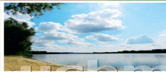
Испарение с реки