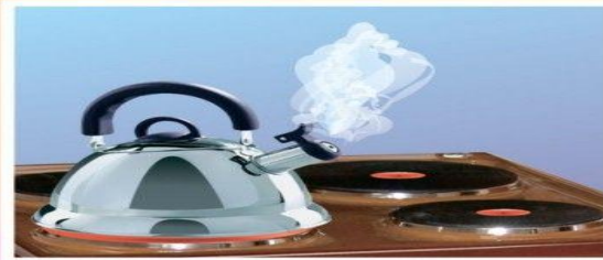
В чайнике вода кипит — Пар из чайника шипит