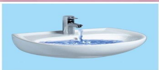
Вода в раковине, ванне и в водопроводе