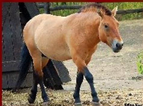
ДИКАЯ ЛОШАДЬ -ТАРПАН

Черные страницы содержат списки тех, кого уже нет, кого мы больше никогда не увидим, кто уже вымер