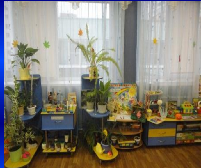
Вид из центра группы в противоположном входу направлении