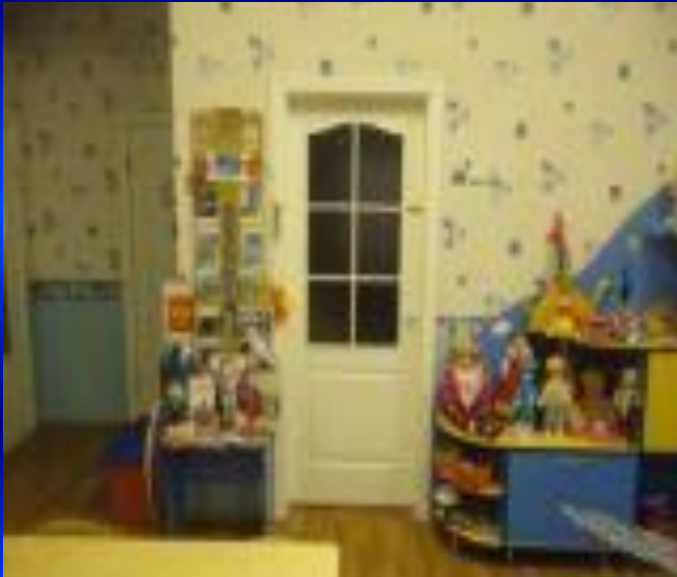
Вид из центра группы на вход в помещение