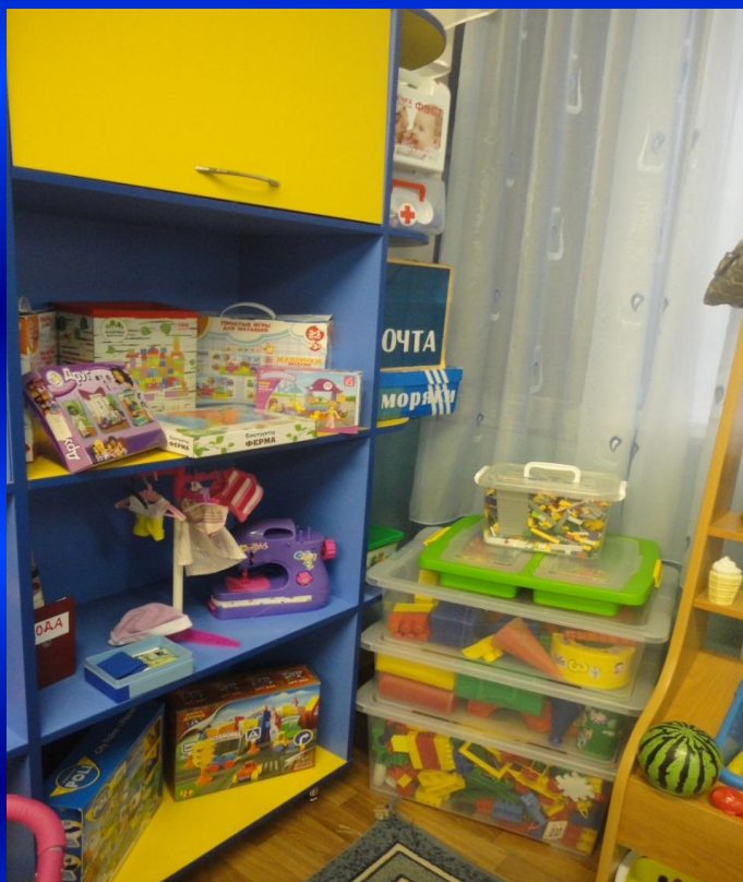
ЦЕНТР СЕНСОРНОГО РАЗВИТИЯ МЕЛКОЙ МОТОРИКИ