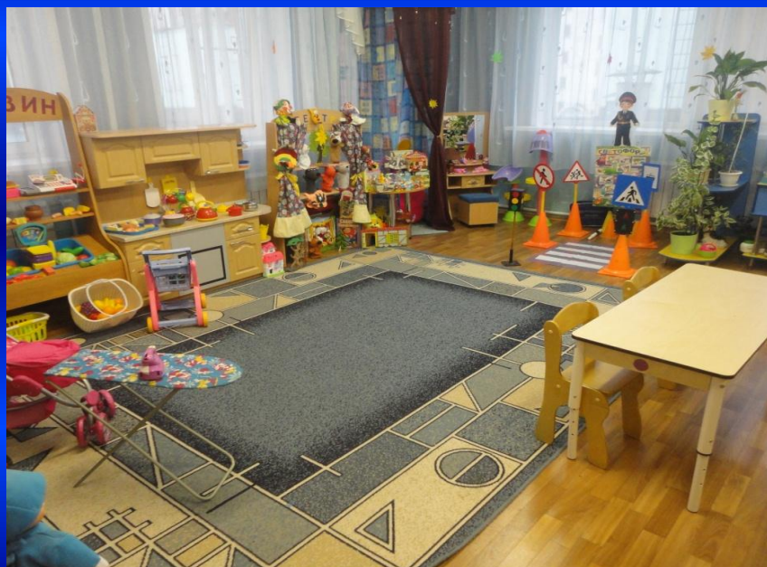
ЦЕНТРЫ СЮЖЕТНО-РОЛЕВЫХ ИГР