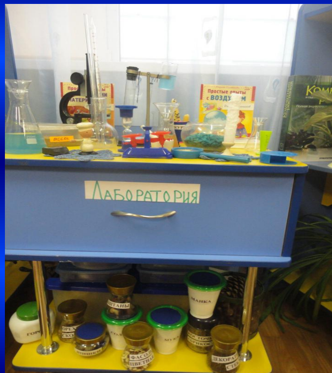
ИССЛЕДОВАТЕЛЬ СКИЙ ЦЕНТР