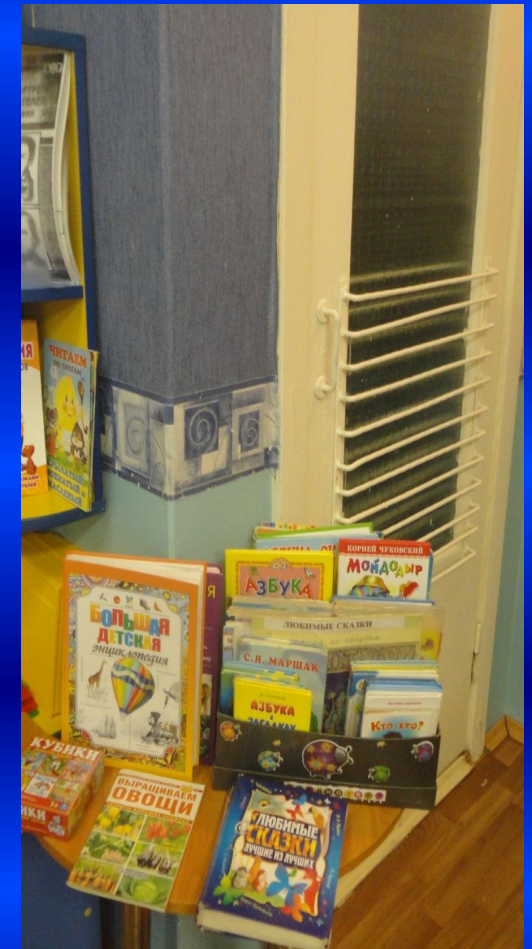
В гостях у сказки