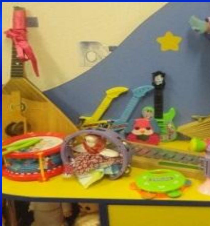
ЦЕНТР МУЗЫКИ «ДО – РЕ - МИ»