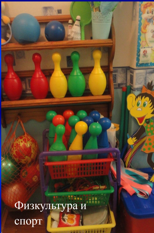
Физкультура и спорт