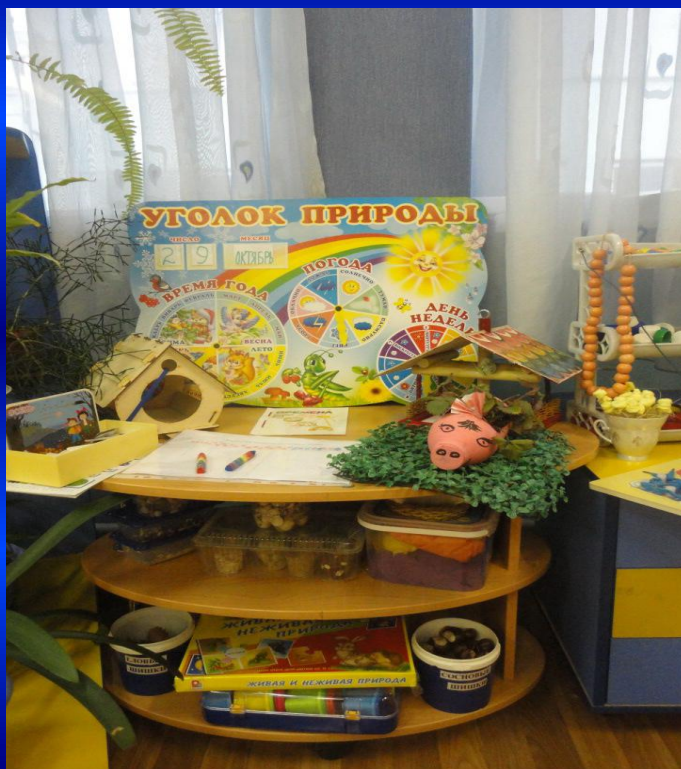
ЦЕНТР НЕЖИВОЙ ПРИРОДЫ