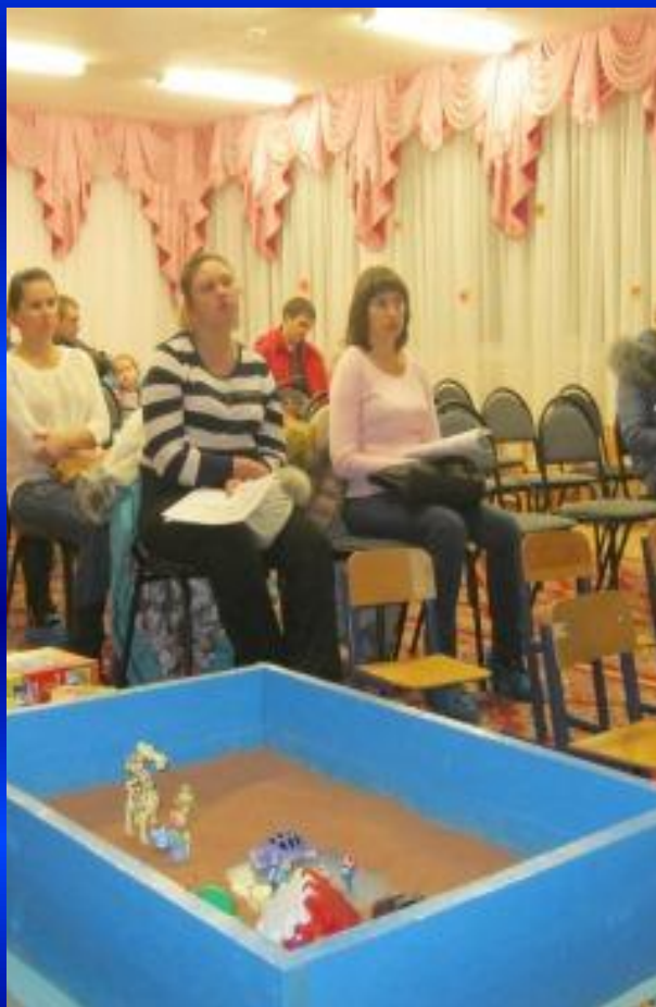
КОСУЛЬТАЦИИ ДЛЯ РОДИТЕЛЕЙ И ИСПОЛЬЗОВАНИЕ МУЛЬТИМЕДИЙНЫХ СРЕДСТВ