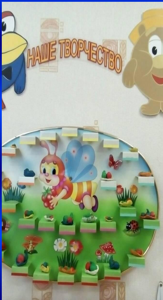
Информация о текущей деятельности