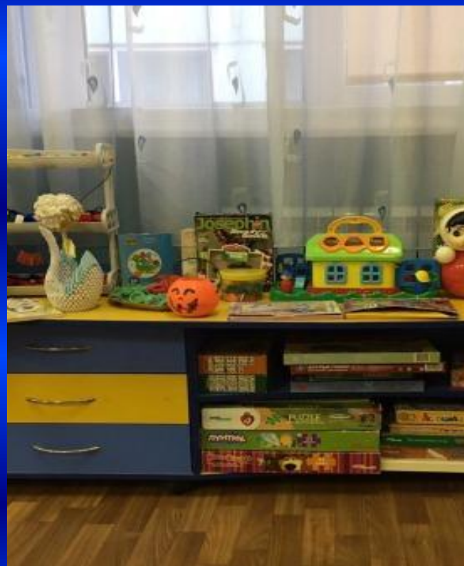
ЦЕНТРЫ СЕНСОРНОГО РАЗВИТИЯ