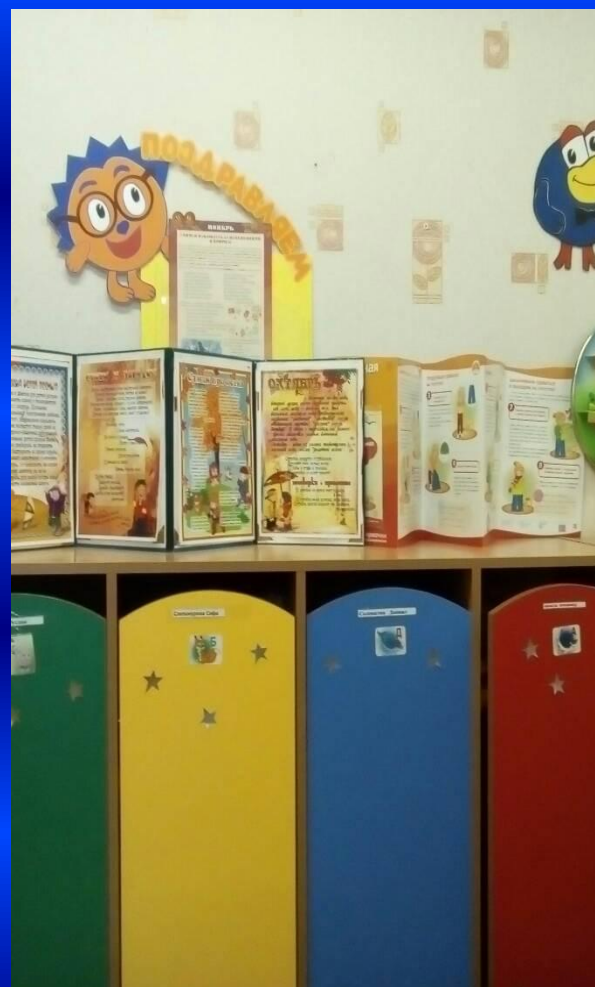
ИНФОРМАЦИЯ ДЛЯ РОДИТЕЛЕЙ