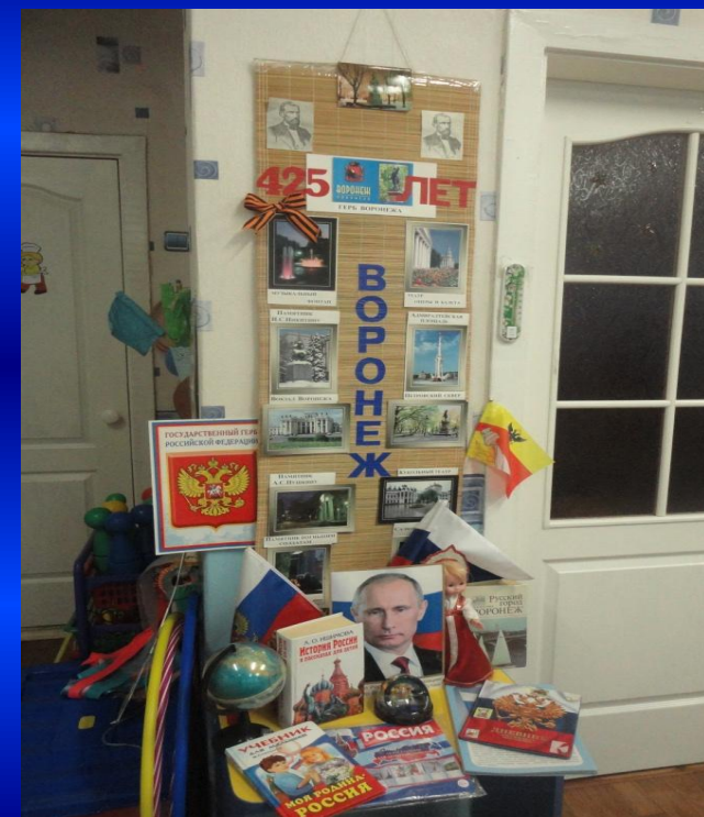
ЦЕНТР ПАТРИОТИЧЕСКО ГО ВОСПИТАНИЯ