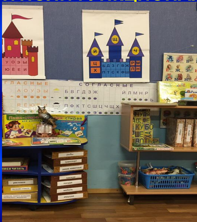
ЦЕНТР РЕЧЕВОГО РАЗВИТИЯ