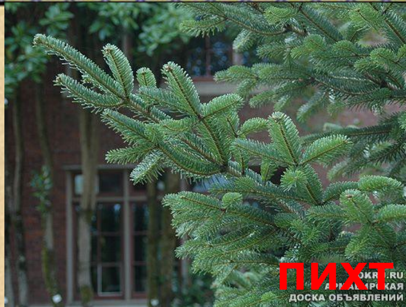
ПИХТ ОКЯ .RU АРИАМРСКАЯ ДОСКА ОБЪЯВЛЕНИИ