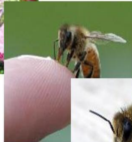
Пчелы - сторожа