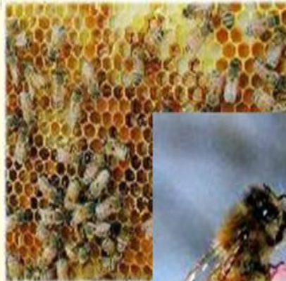
Пчелы – строители