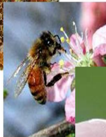
Пчелы - сборщицы