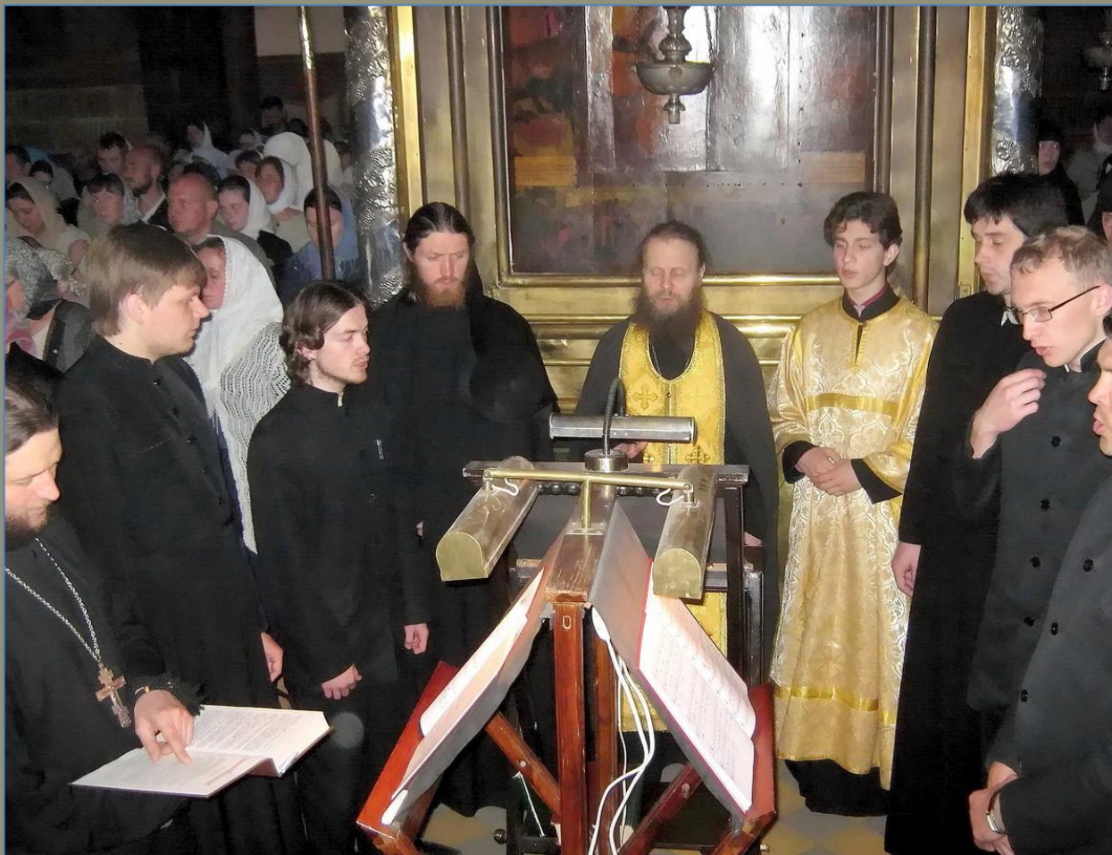
Знаменитый хор Троицкого собора