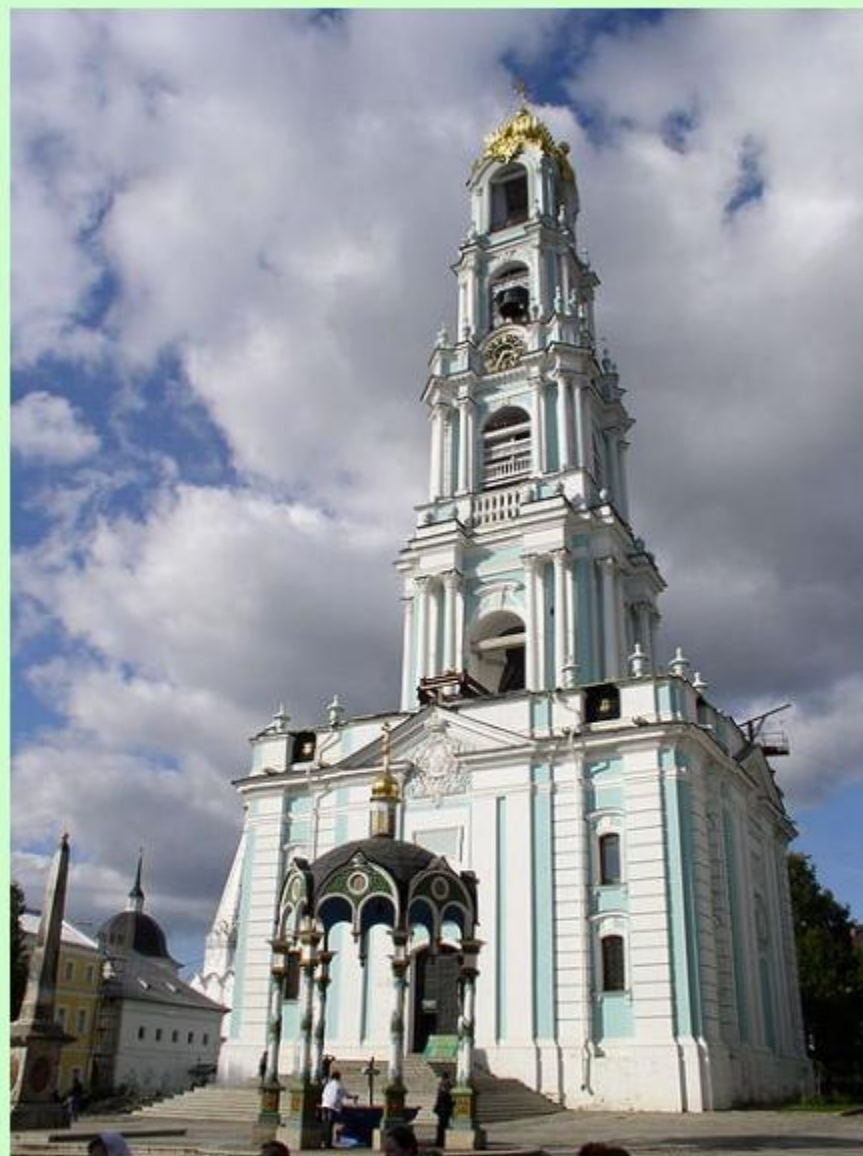
Троице-Сергиева лавра. Колокольня