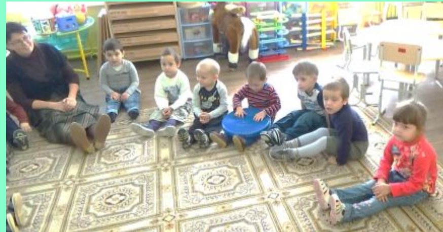
«Маленький ёжик- четвероножник»