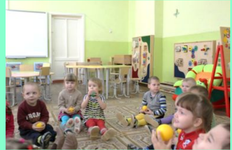
«Мы листики осенние на дереве сидели»