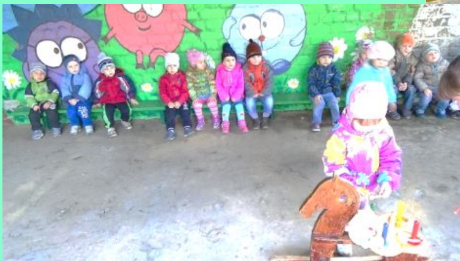
«Как в саду- садочке выросли цветочки»