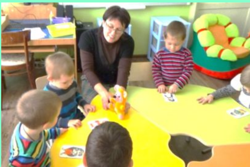
«Как найти зверушке хвост?»