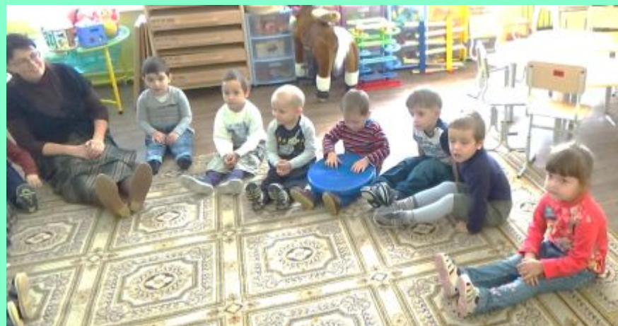
«Маленький ёжик- четвероножник»