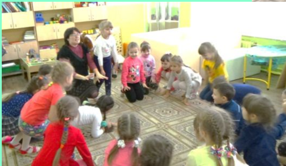
«Наши алые цветы»