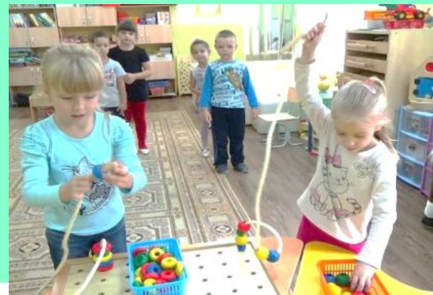
«Бусы с секретиком»