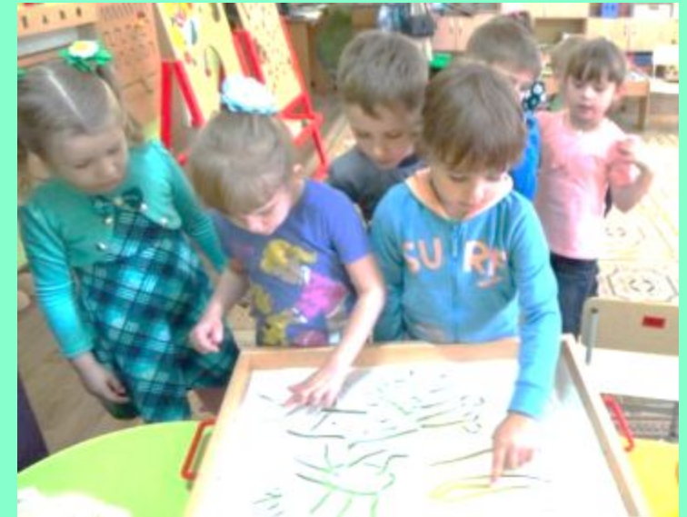
Коллективный рисунок «За что я люблю осень»