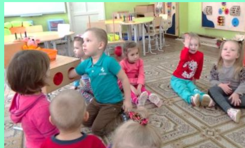
«Запасы из кладовки»