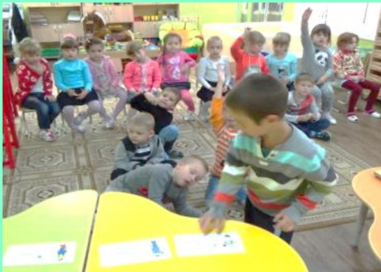
«Чем пахнут ремёсла?»