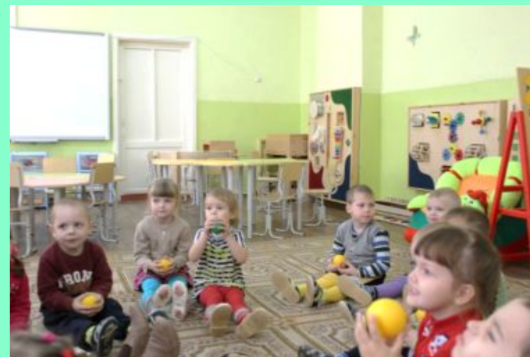
«Мы листики осенние на дереве сидели»