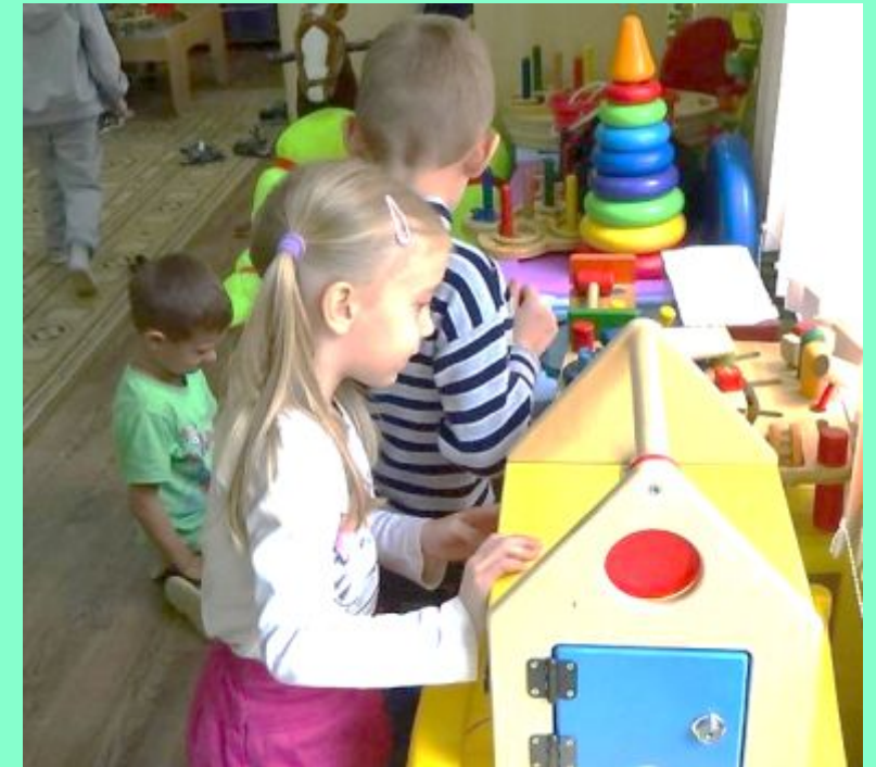
«Домик с дверцами»