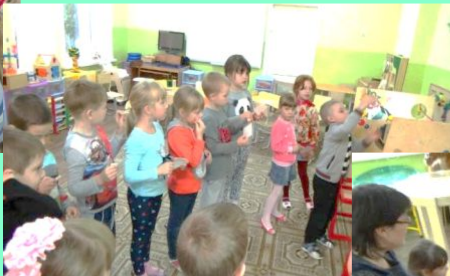
«Цепочка из имён»