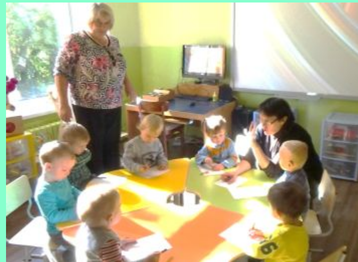
«Что прячется в ладошке?»