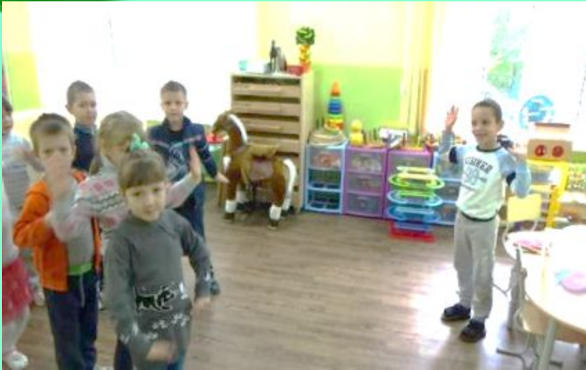
Игра: «Следочки- ладошки»