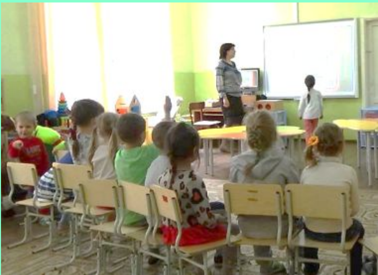
«Почему наступает осень?»