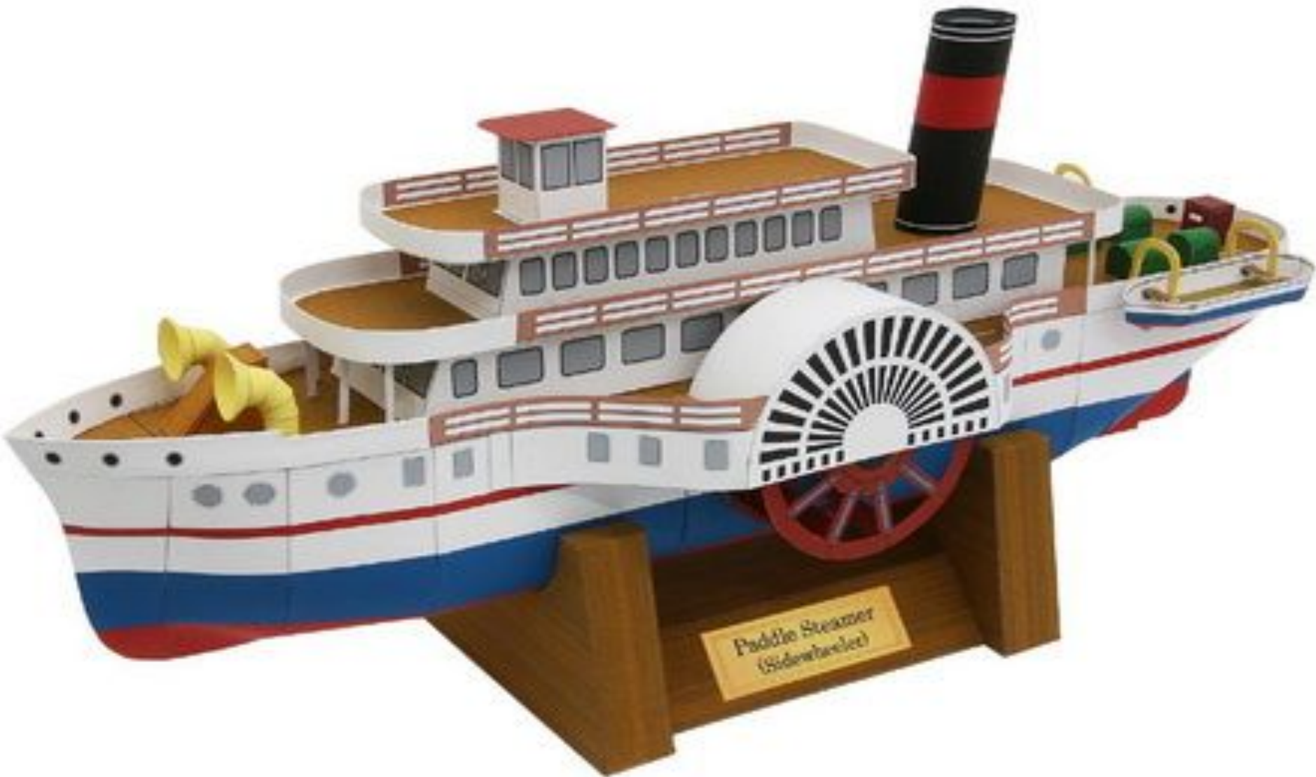
Paddle Steamer (Sidewheeler)