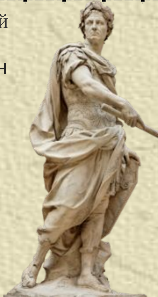
• Гай Юлий Цезарь