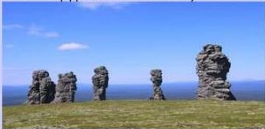
Гора Мань-Пупу-нёр (что на языке манси означает «Малая гора идолов»)

240 особо охраняемых природных территорий (ООПТ): природные заказники 164, 73 памятника природы, Печоро-Илычский государственный природный биосферный заповедник и национальный парк «Югыд ва» (самый большой по площади во всей России).