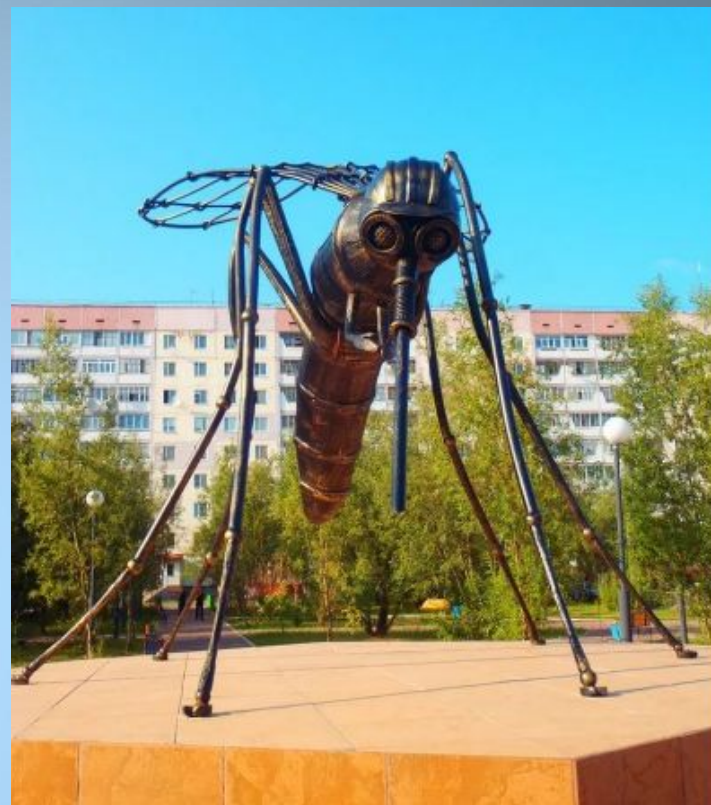
Памятник комару нефтянику