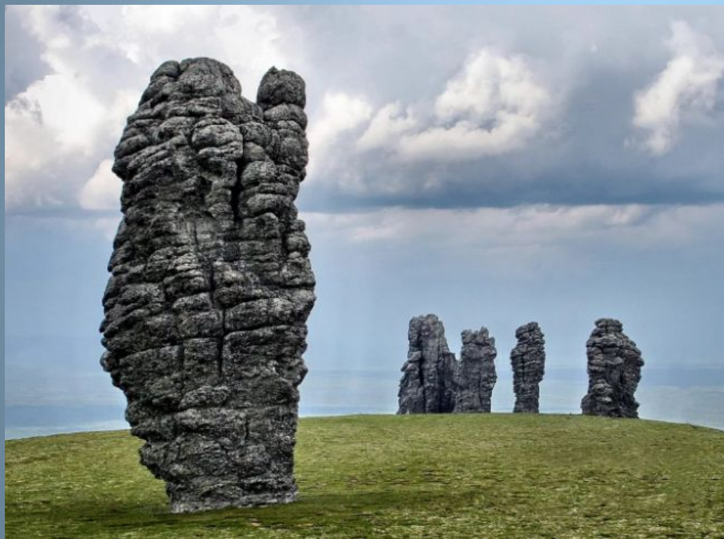
Столбы выветривания на плато Мань-Пупу-Нёр