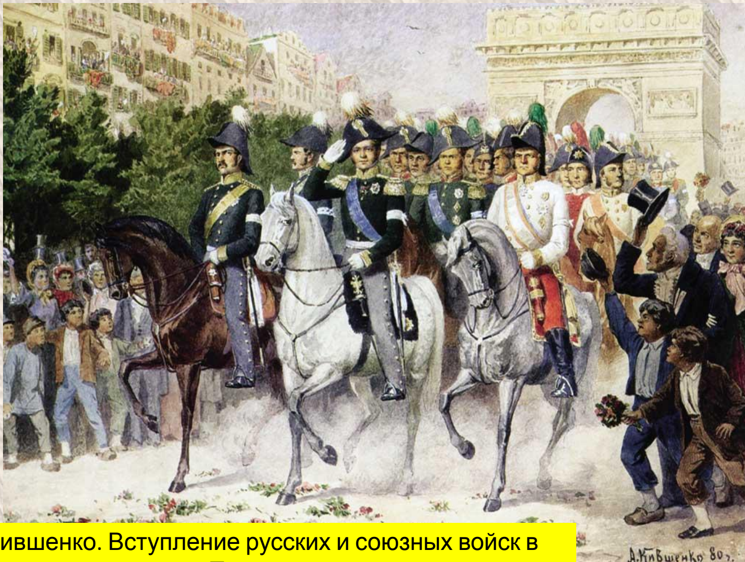
А. Кившенко. Вступление русских и союзных войск в Париж.

В 1814 году русские войска и их союзники вошли в Париж. Так закончилась попытка поставить Россию на колени.