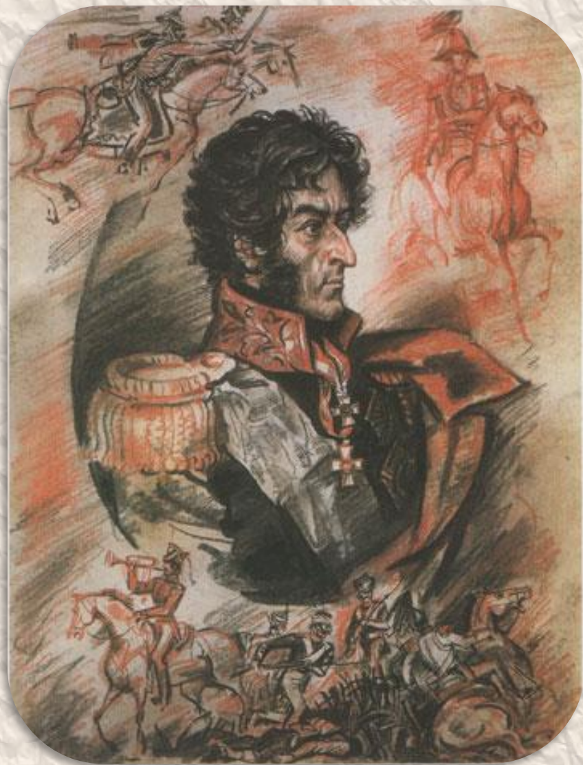
Пётр Иванович Багратион