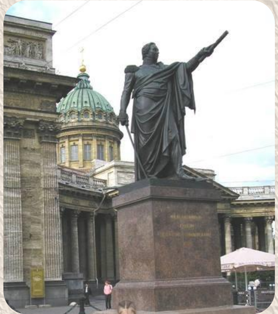
Памятник Кутузову около Казанского собора.