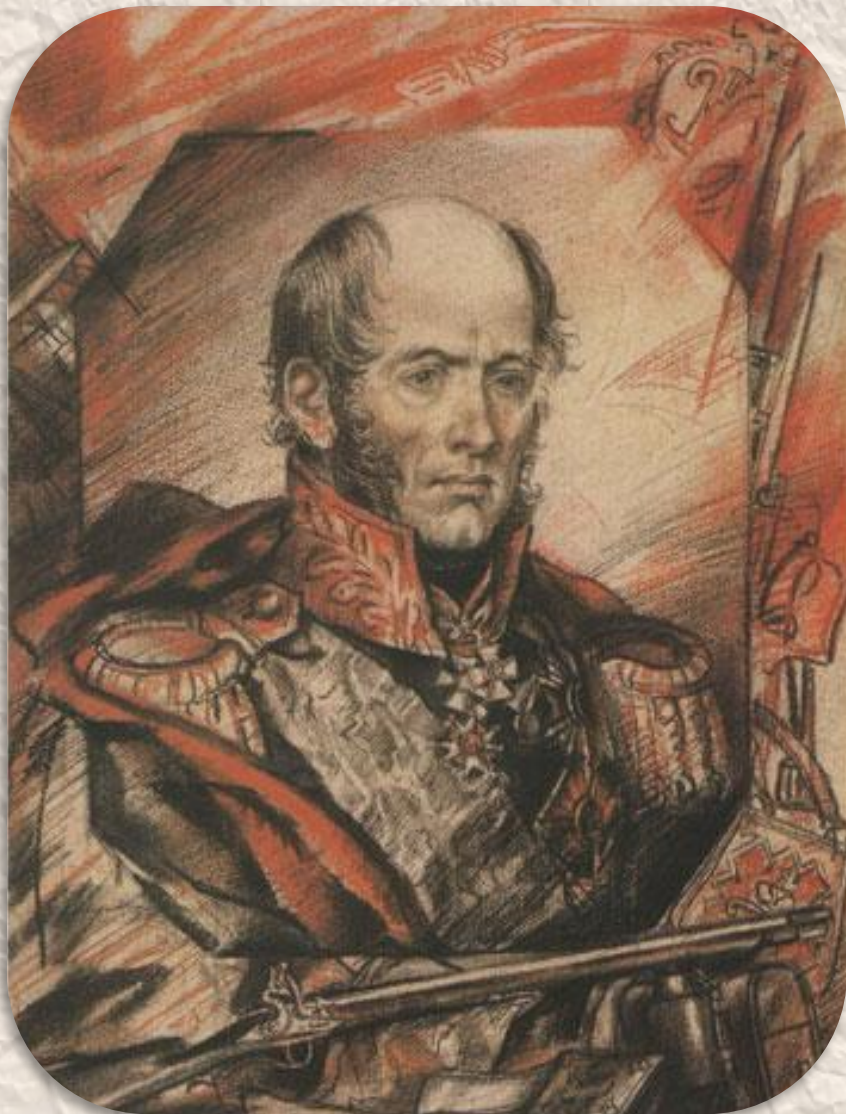
Михаил Богданович Барклай де Толли