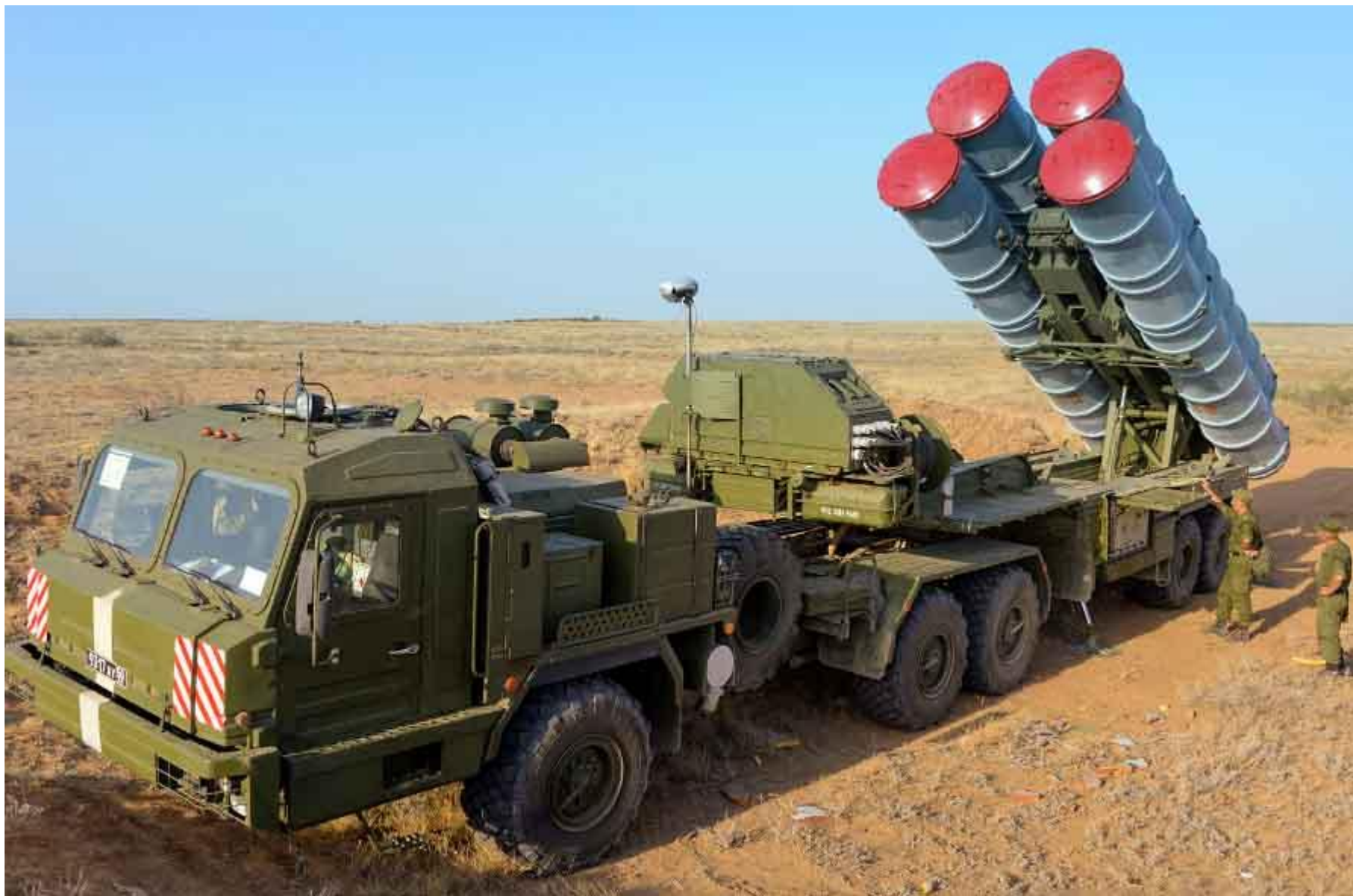
Ракетный комплекс С400