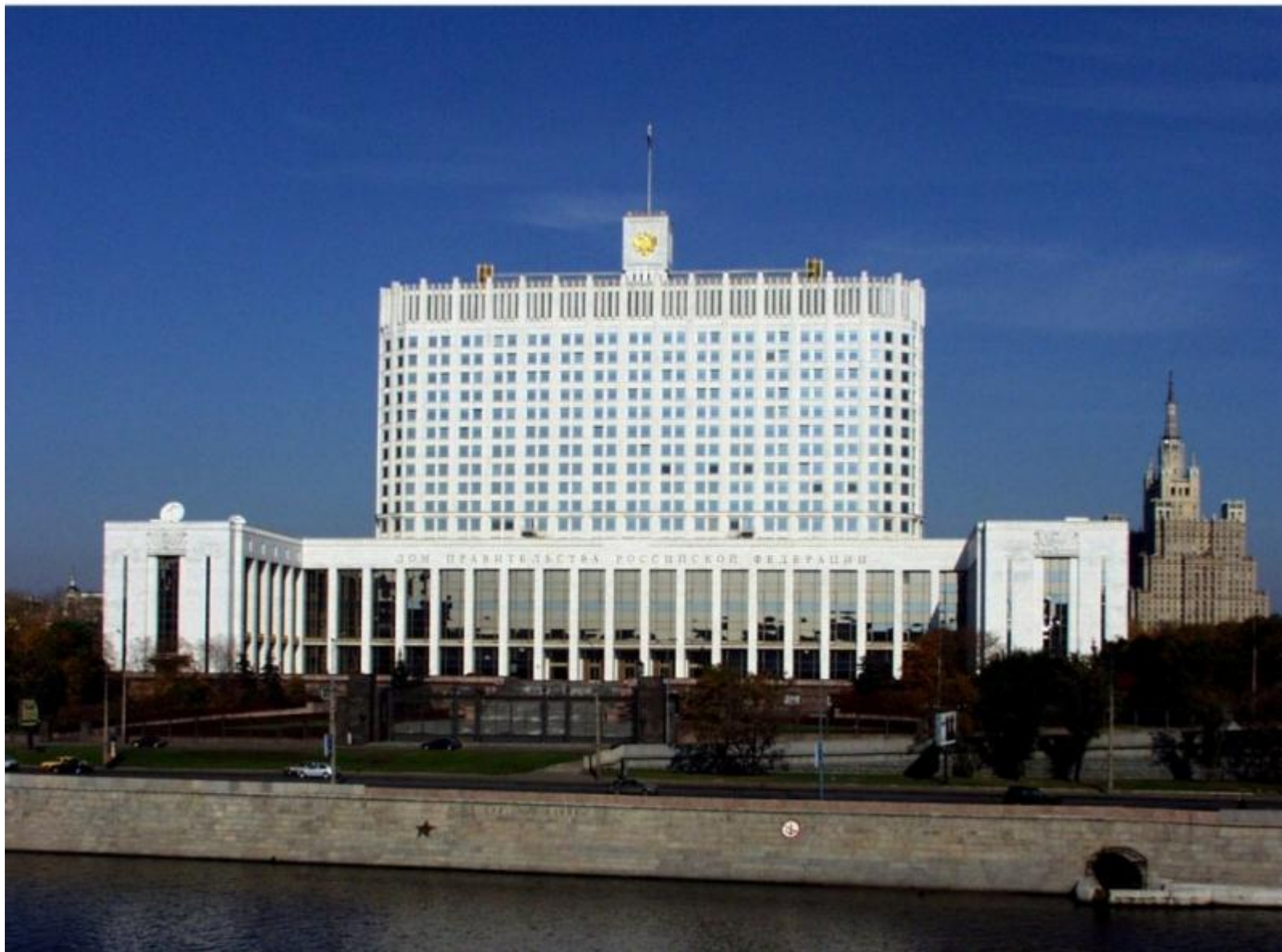
Дом Правительства РФ