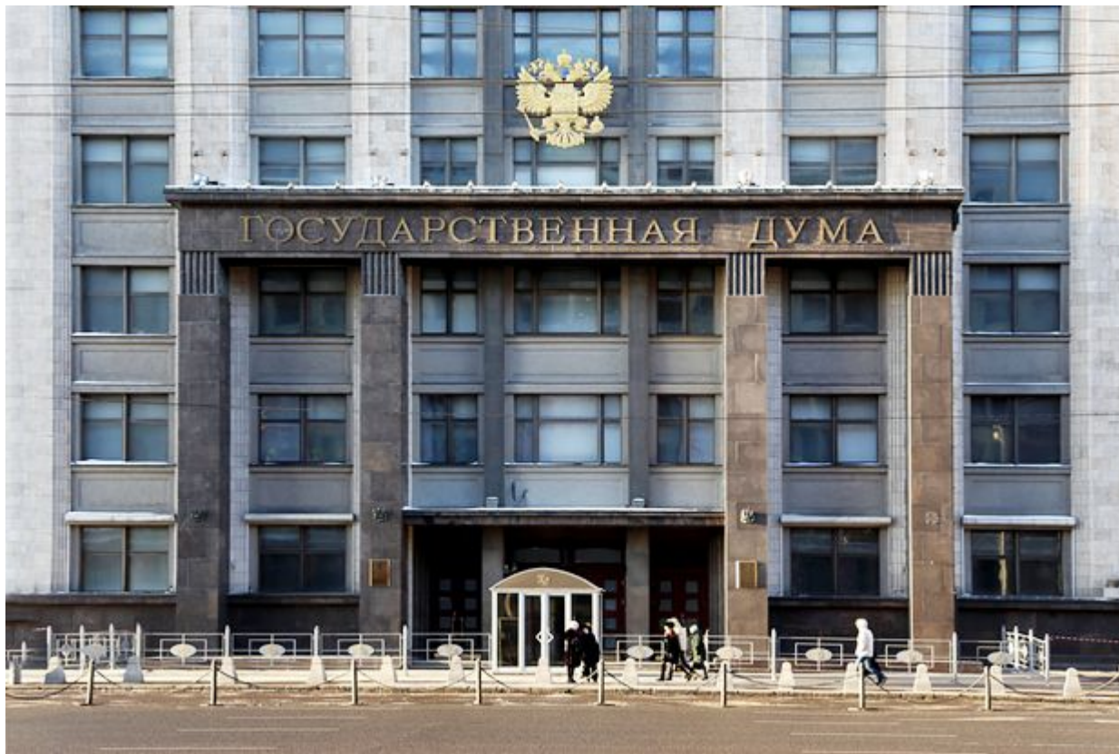
Здание Государственной думы