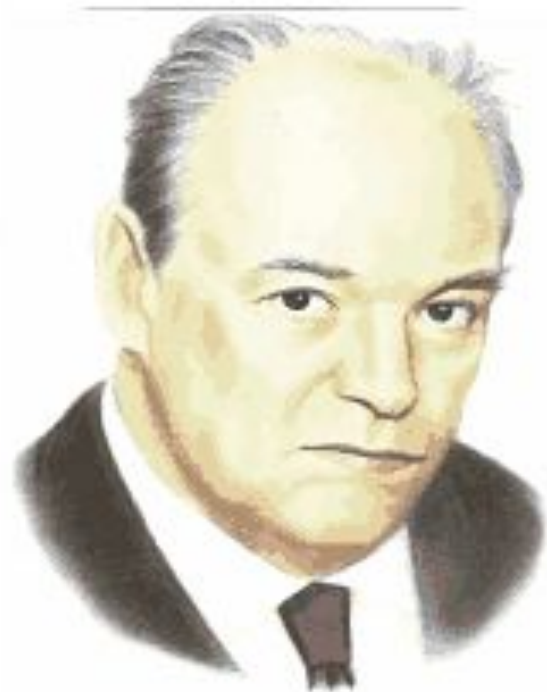
Чарушин Евгений Иванович (1901-1965)