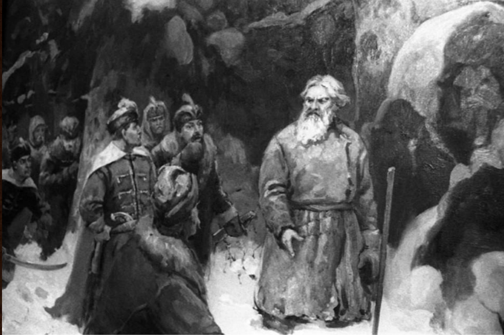
Иван Сусанин в дремучем лесу с поляками