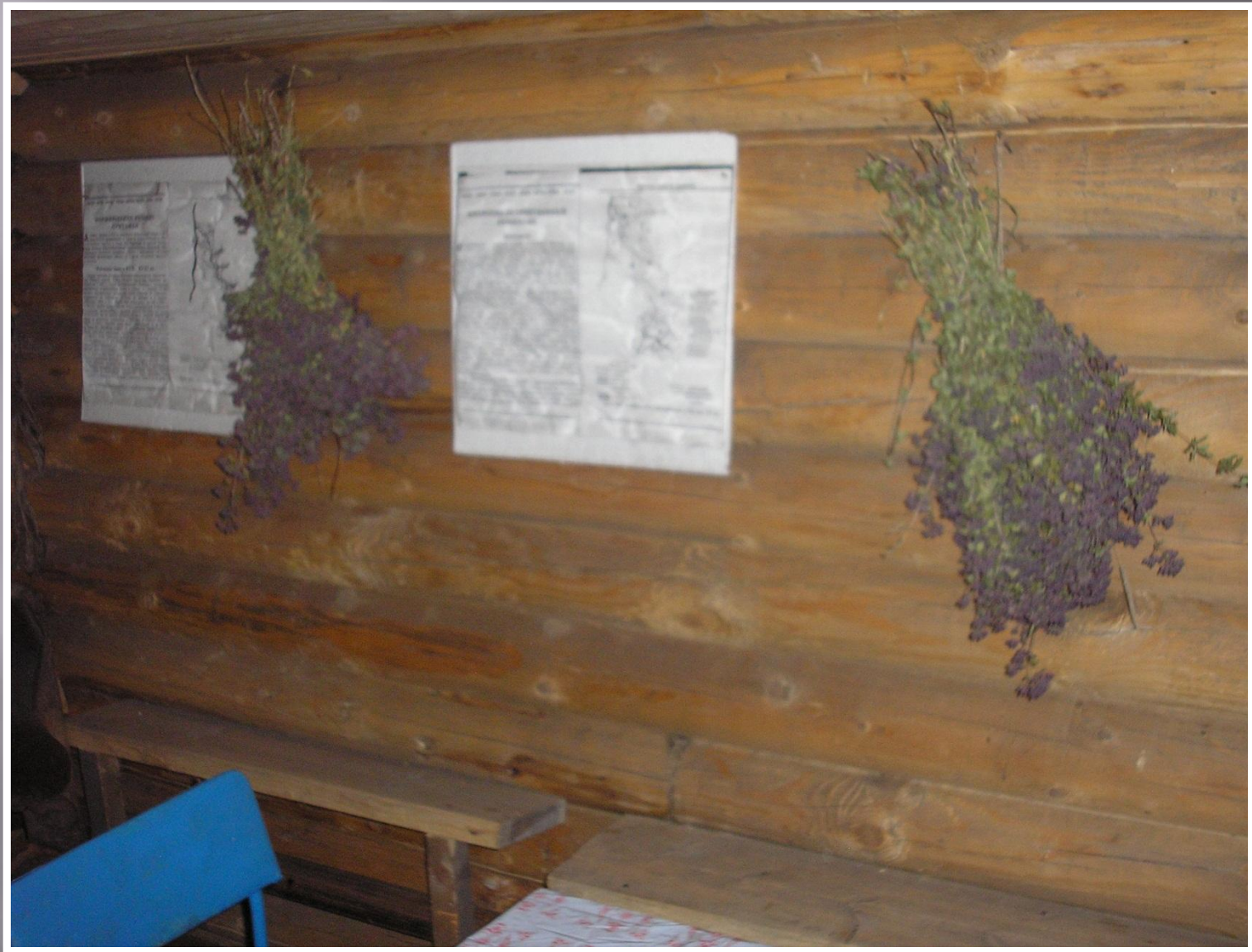
Из домашних ремесел