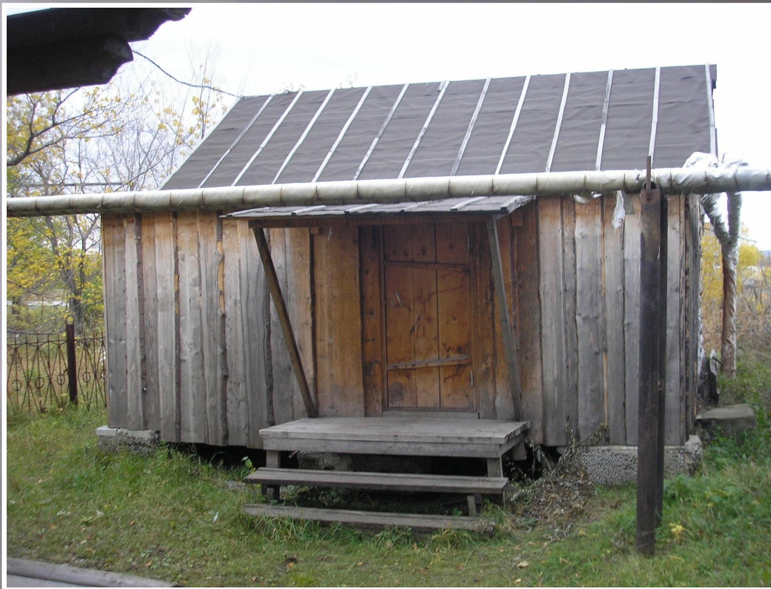
Рыболовство занимало в телеутском хозяйстве