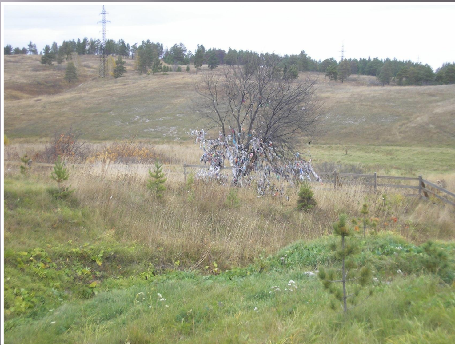
Новокузнецкого района (поселок Телеут).