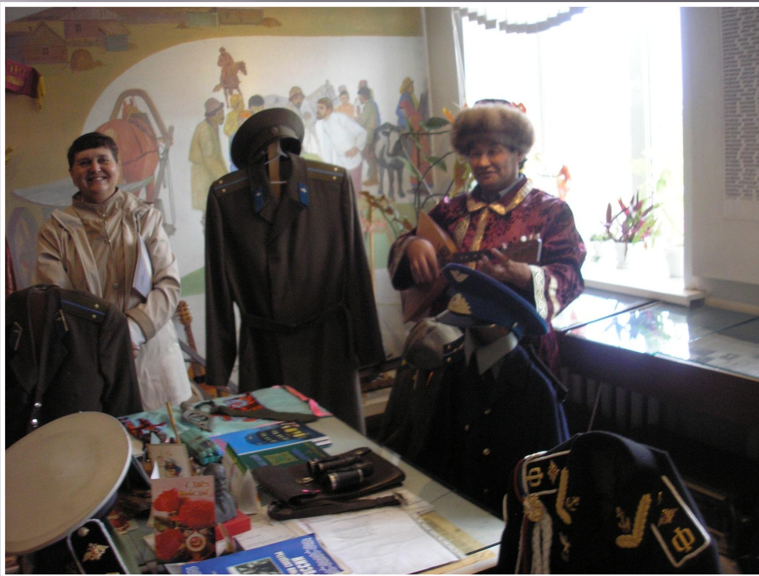
Телеуты включены в состав районов Крайнего Севера.