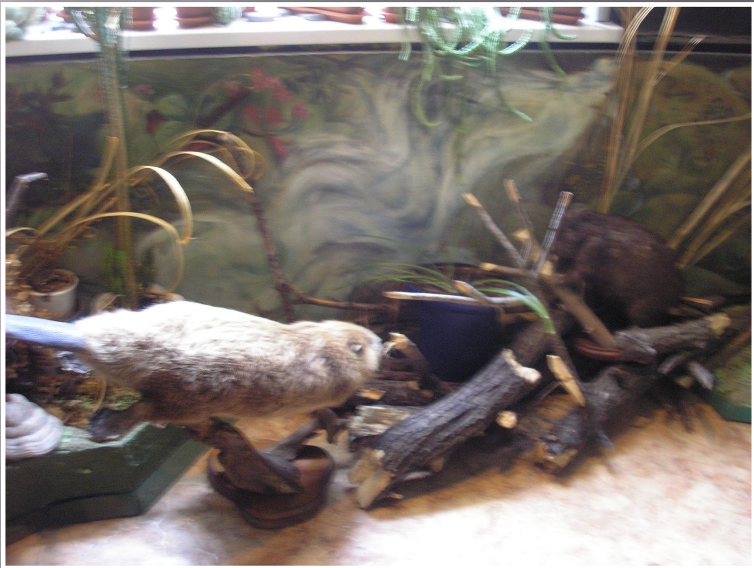
Охотились на марала,