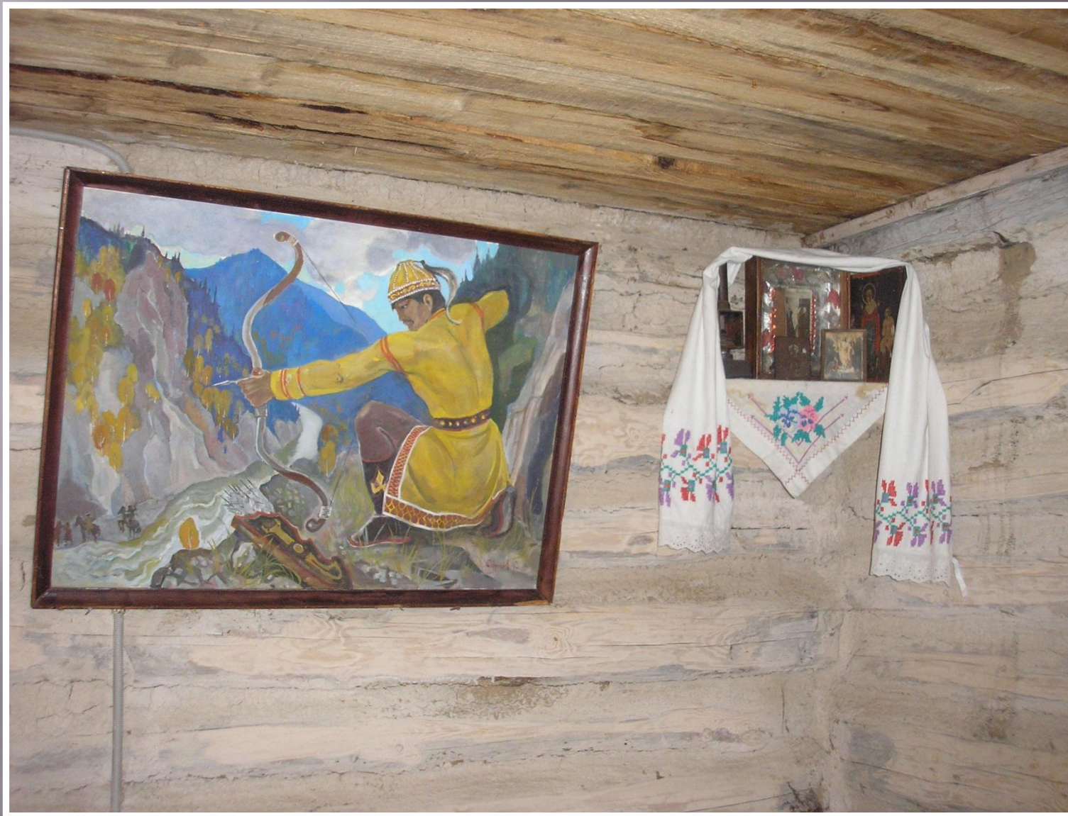
на территории Кемеровской области