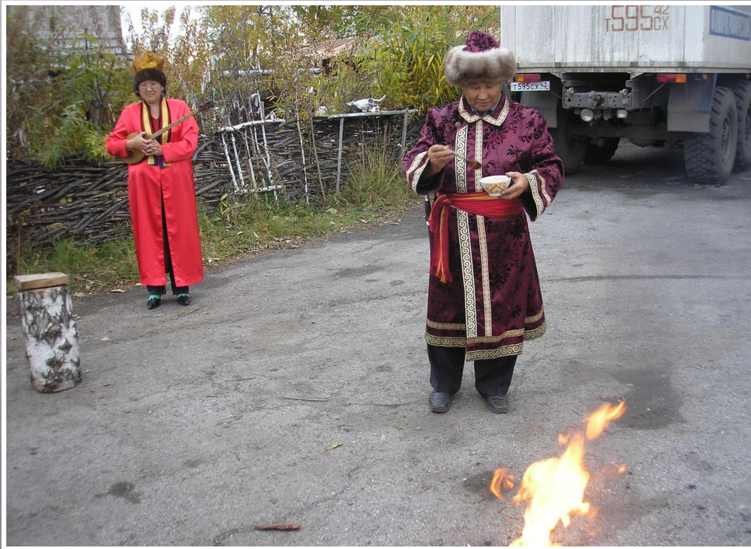
Телеуты являются вторым тюркоязычным народом Кузбасса,