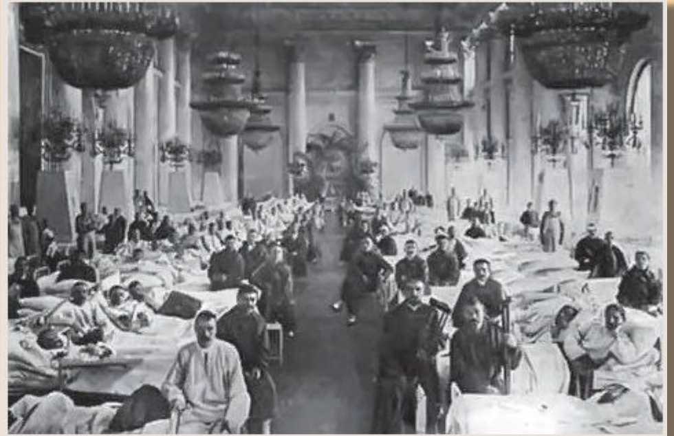
Лазарет в Зимнем дворце

Семья императора Николая II отдала под военные лазареты свой главный дом на Дворцовой площади и почти все загородные дворцы и резиденции по всей Российской империи.