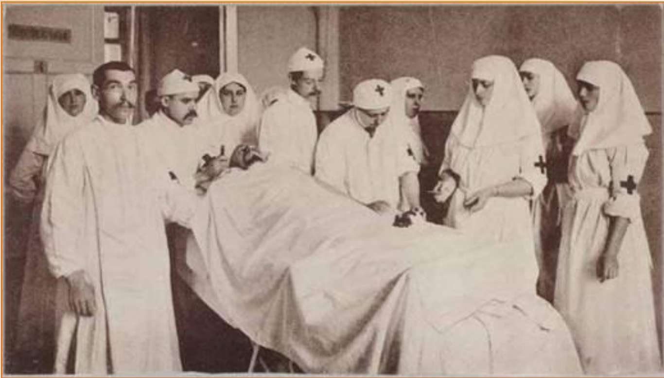
В операционной (Императрица Александра Федоровна подает инструменты во время операции)

Царская семья - это простые люди, которым свойственно любить, страдать, расстраиваться, переживать, думать. Во время первой мировой войны императрица Александра Федоровна и ее старшие дочери, великие княжны Ольга и Татьяна трудились в лазарете с 1914 по 1917 год .