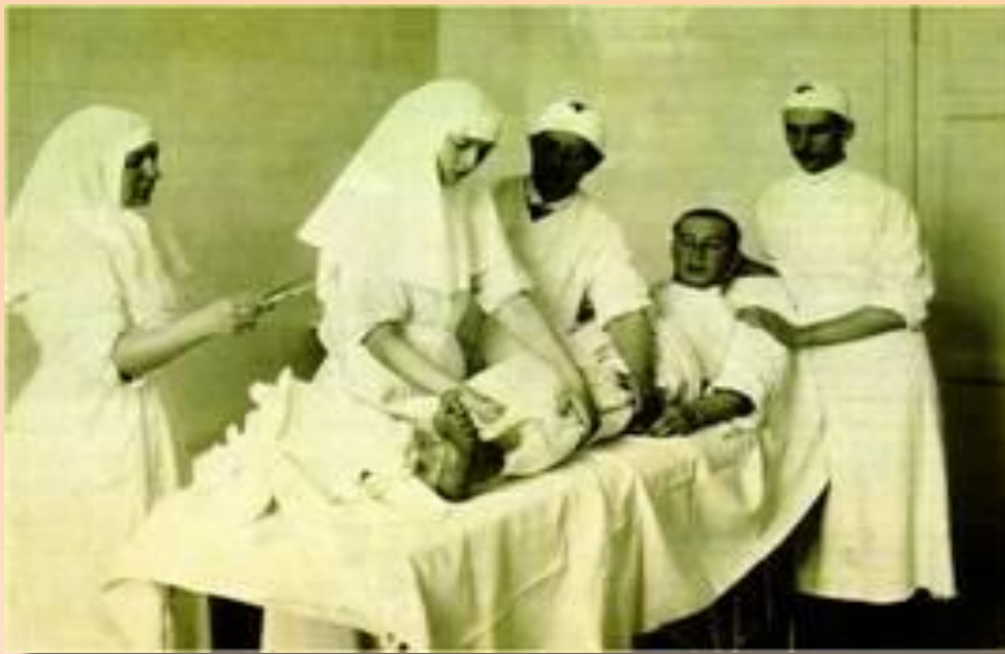
Великая княжна Татьяна Николаевна на перевязке раненого.

Семья императора Николая II отдала под военные лазареты свой главный дом на Дворцовой площади и почти все загородные дворцы и резиденции по всей Российской империи.