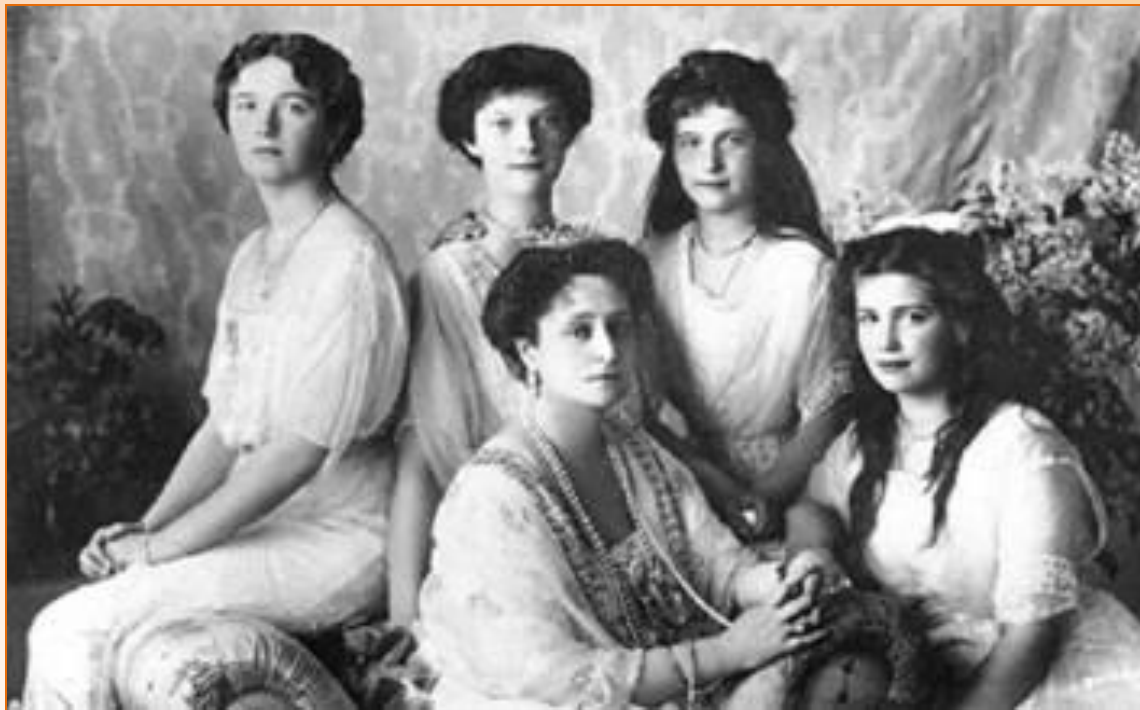
Императрица Александра Федоровна с дочерьми

Царская семья стала образцом высокой нравственности, благочестия и милосердия.