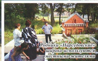
Родники «Нарудовские» широко используются местными жителями