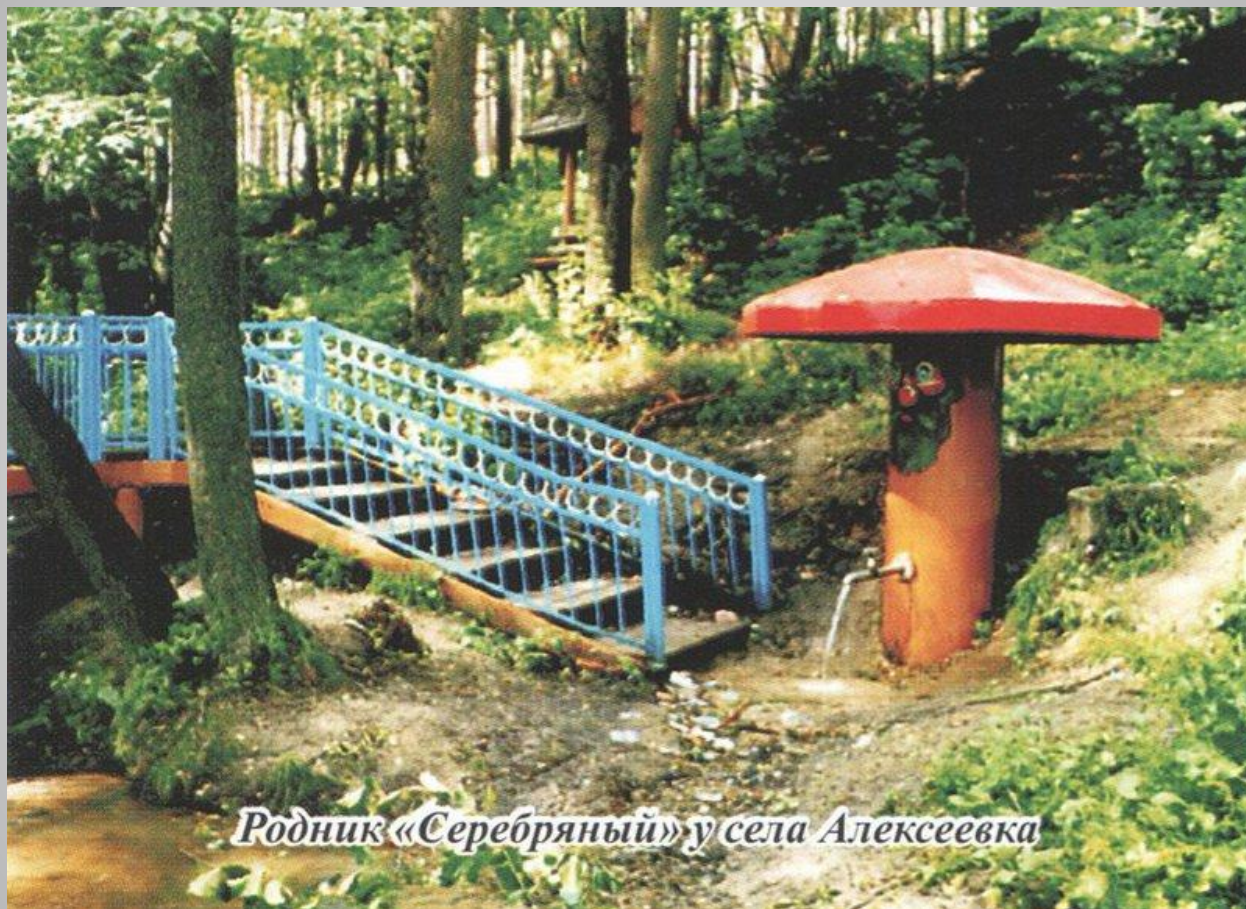
Родник «Серебряный» у села Алексеевка