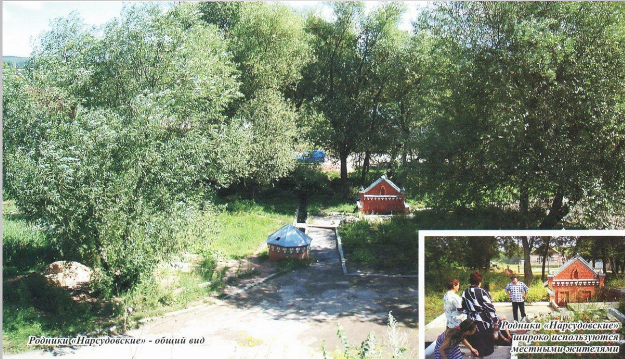
Родники «Нарудовские» - общий вид