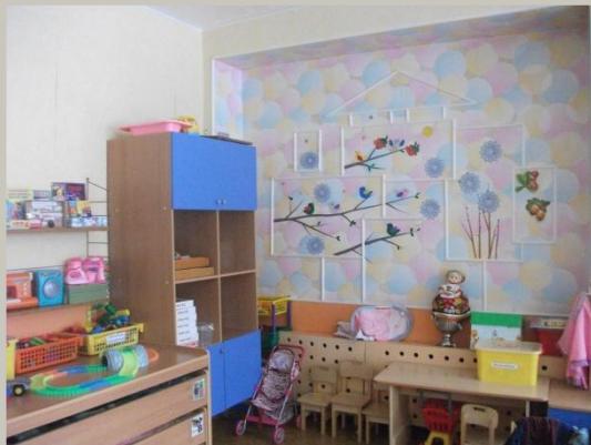
Верхняя левая точка