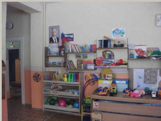
Вход в группу; нижняя левая точка