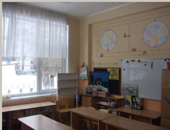
● Нижняя правая точка

Вид (средний возраст) группы с четырех точек по периметру.