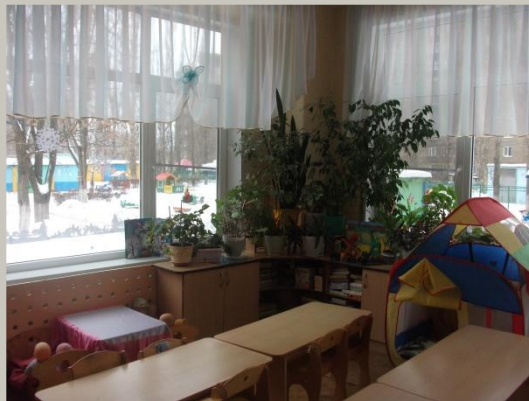
Верхняя правая точка