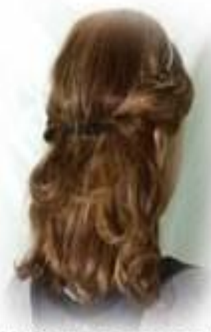
2 ШАГ. Загните волосы по бокам под резинку.