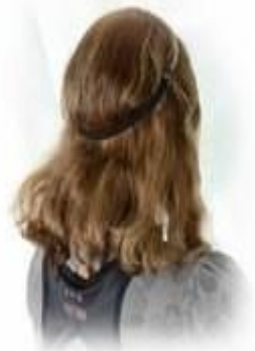
1 ШАГ. Наденьте ободок сверху на голову.