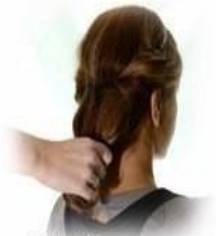
3 ШАГ. Соберите оставшиеся волосы вместе.