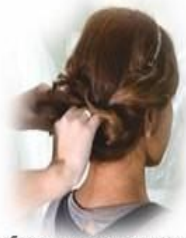
4 ШАГ. Уберите собранные волосы под резинку. Можно убирать локоны поочередно.