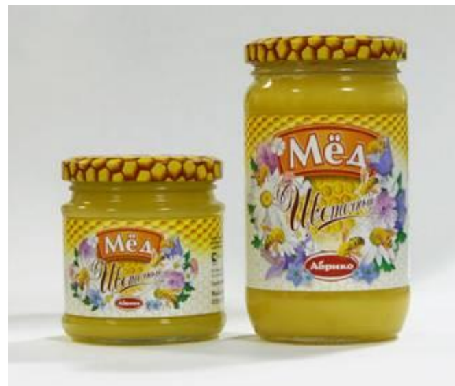
5. Банка с мёдом.