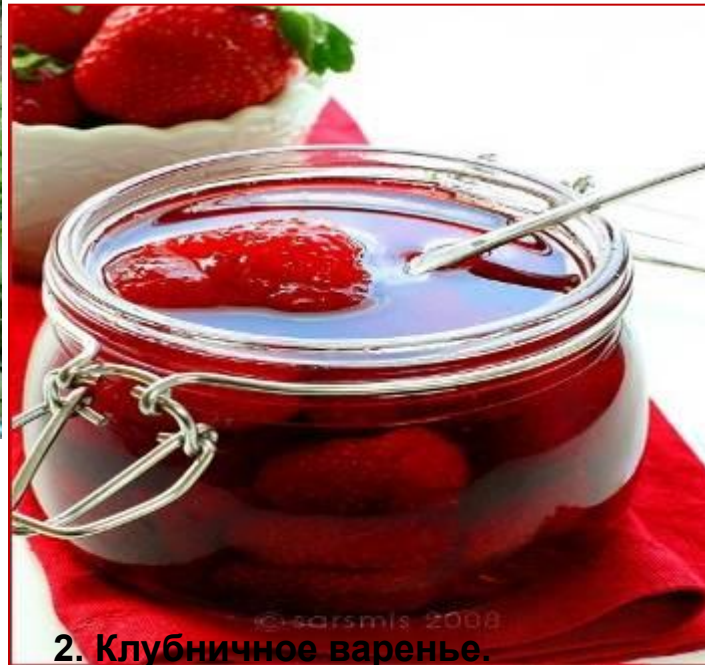
2. Клубничное варенье.