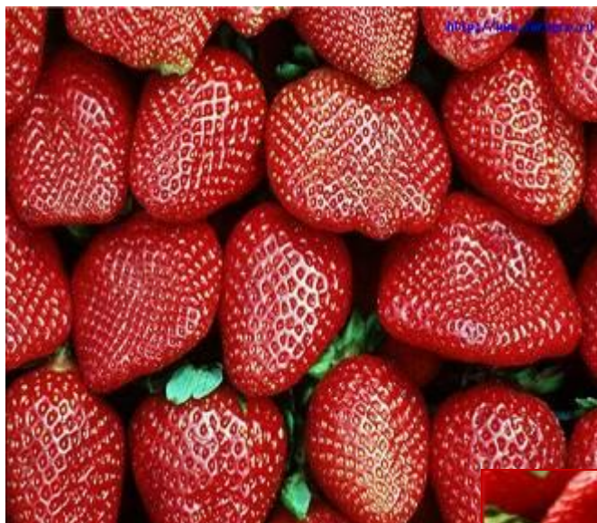
2. Ягоды клубники