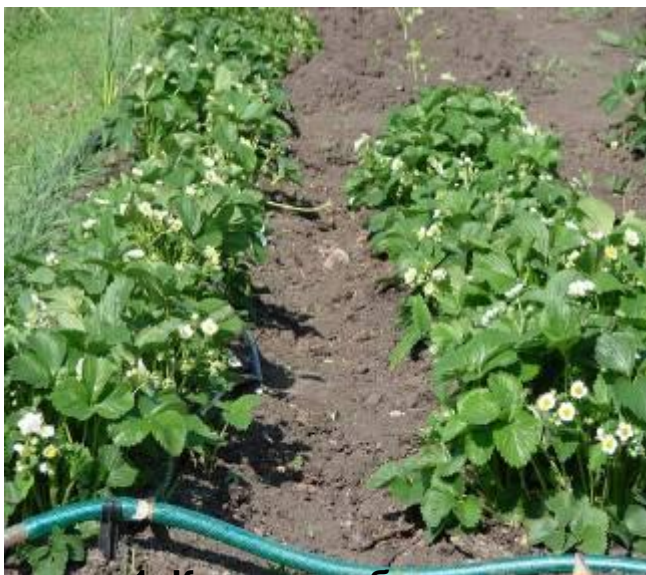
1. Кусты клубники.