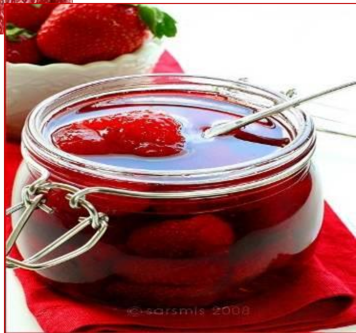
3. Клубничное варенье.