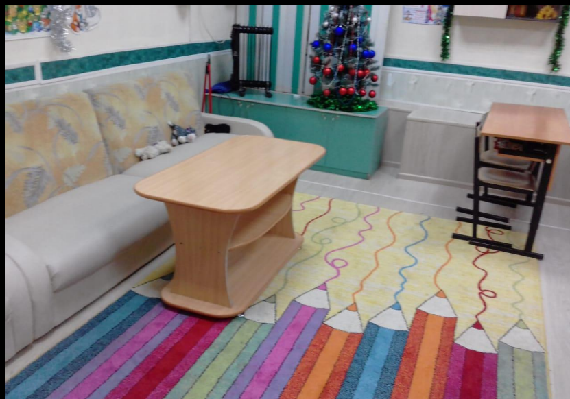
Верхняя правая точка