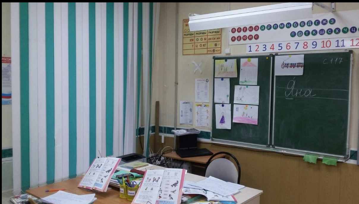
1.6. Рабочий сектор (методическая литература педагога)