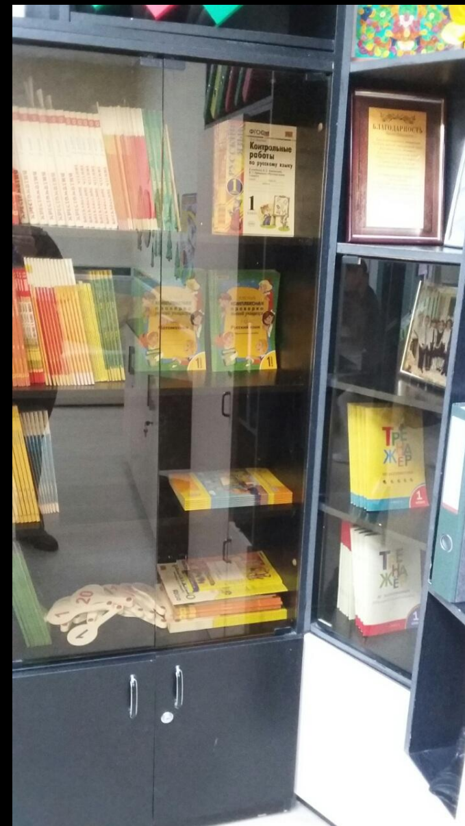
1.7. Рабочий сектор (ИКТ для педагога)