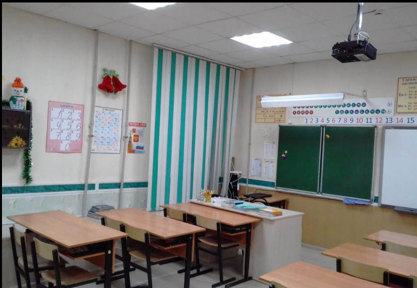
Верхняя левая точка