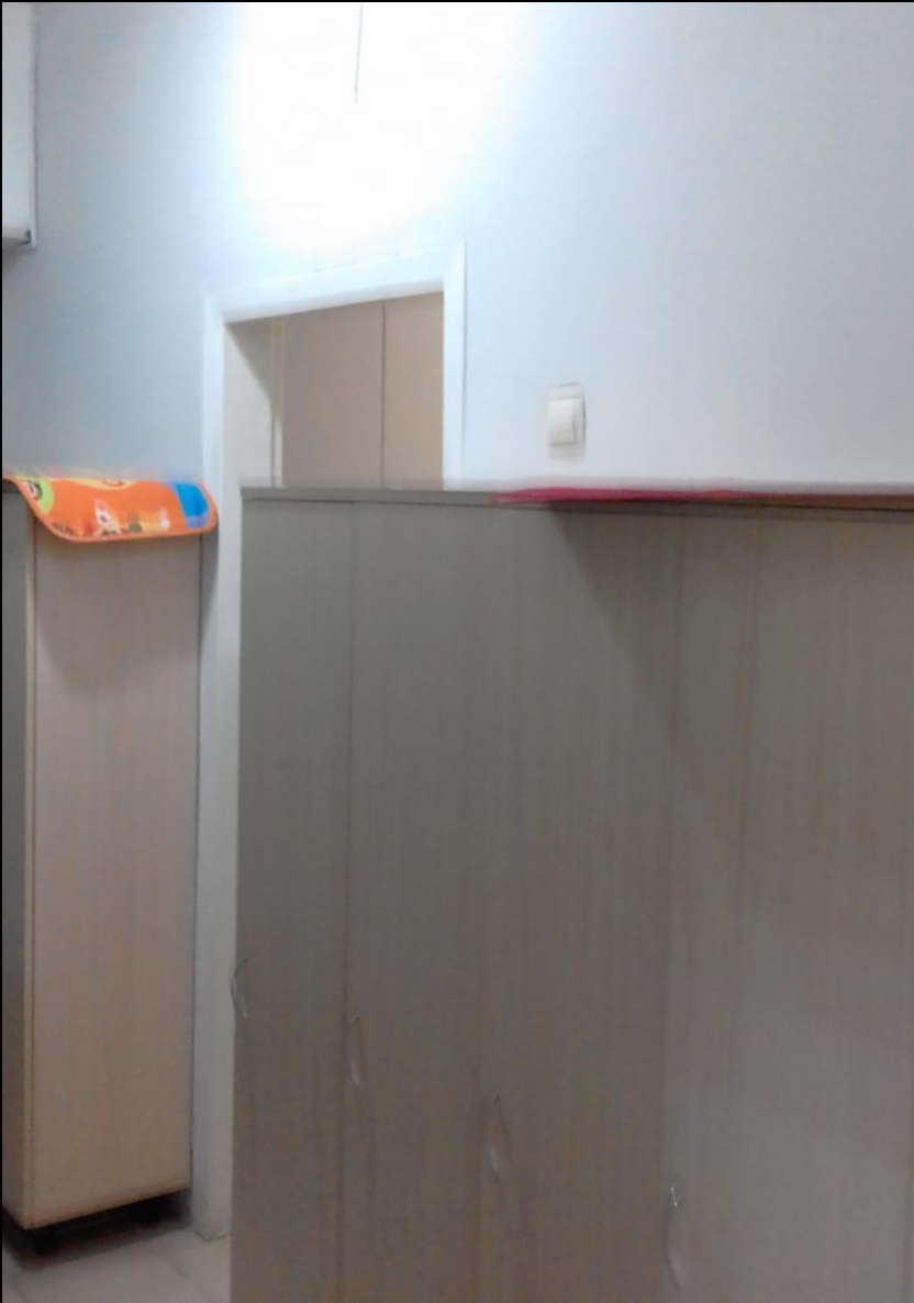
Среда для диалога с родителями