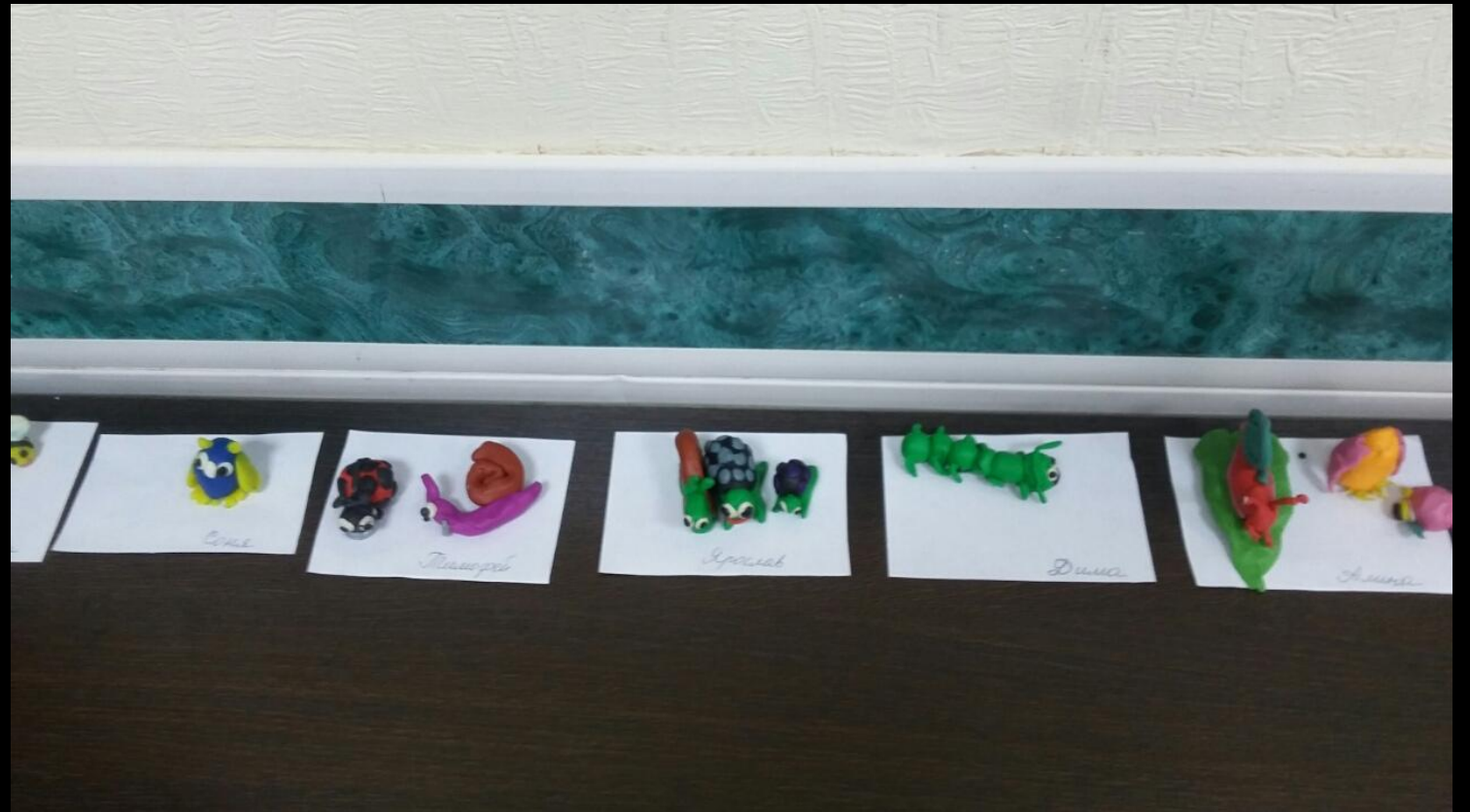
Среда для диалога с родителями