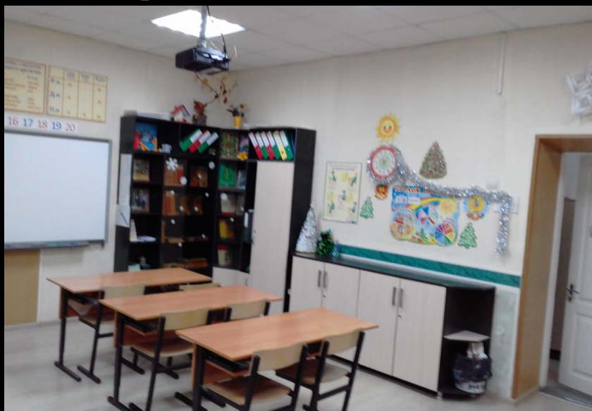
Вход в группу, нижняя левая точка