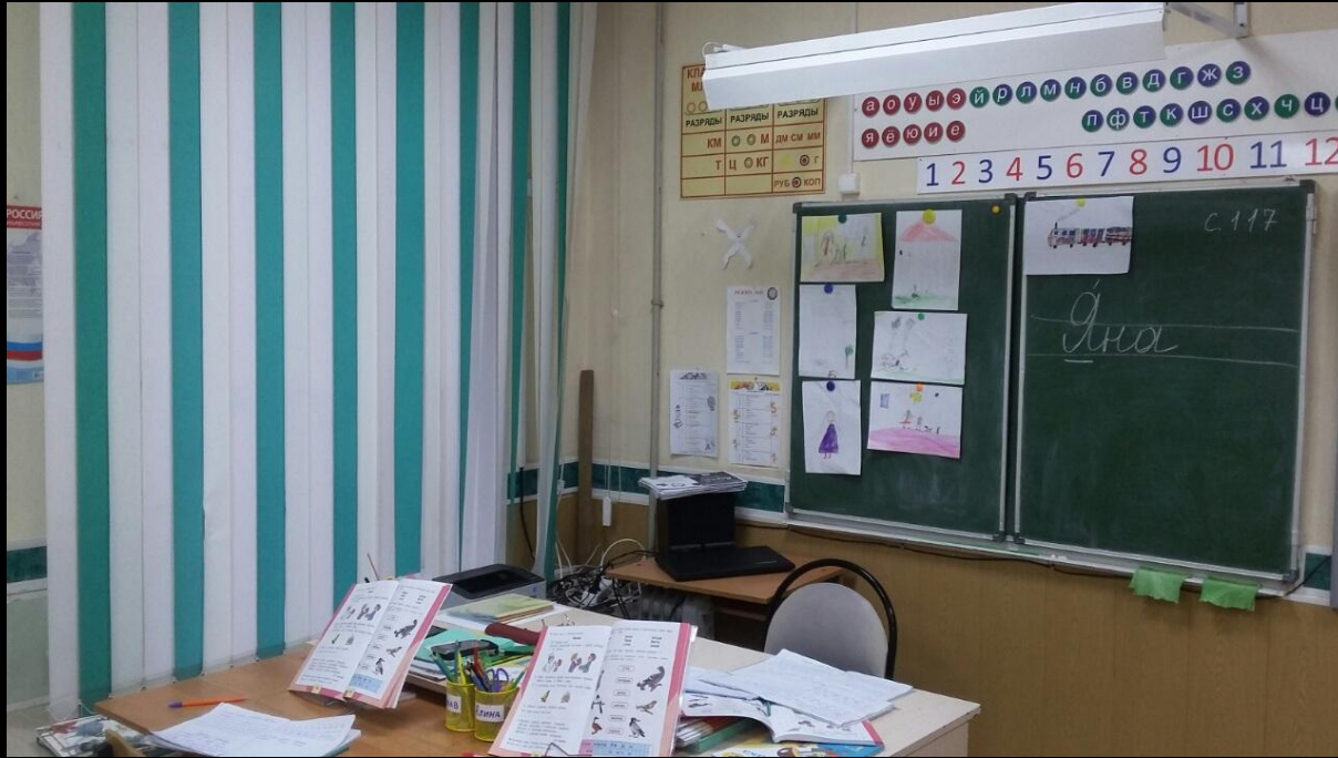
1.6. Рабочий сектор (методическая литература педагога)