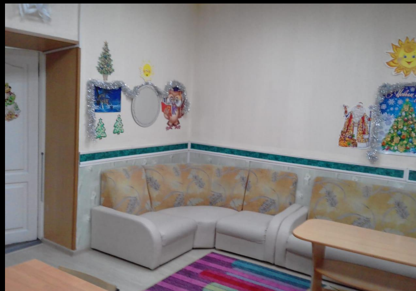
Нижняя правая точка