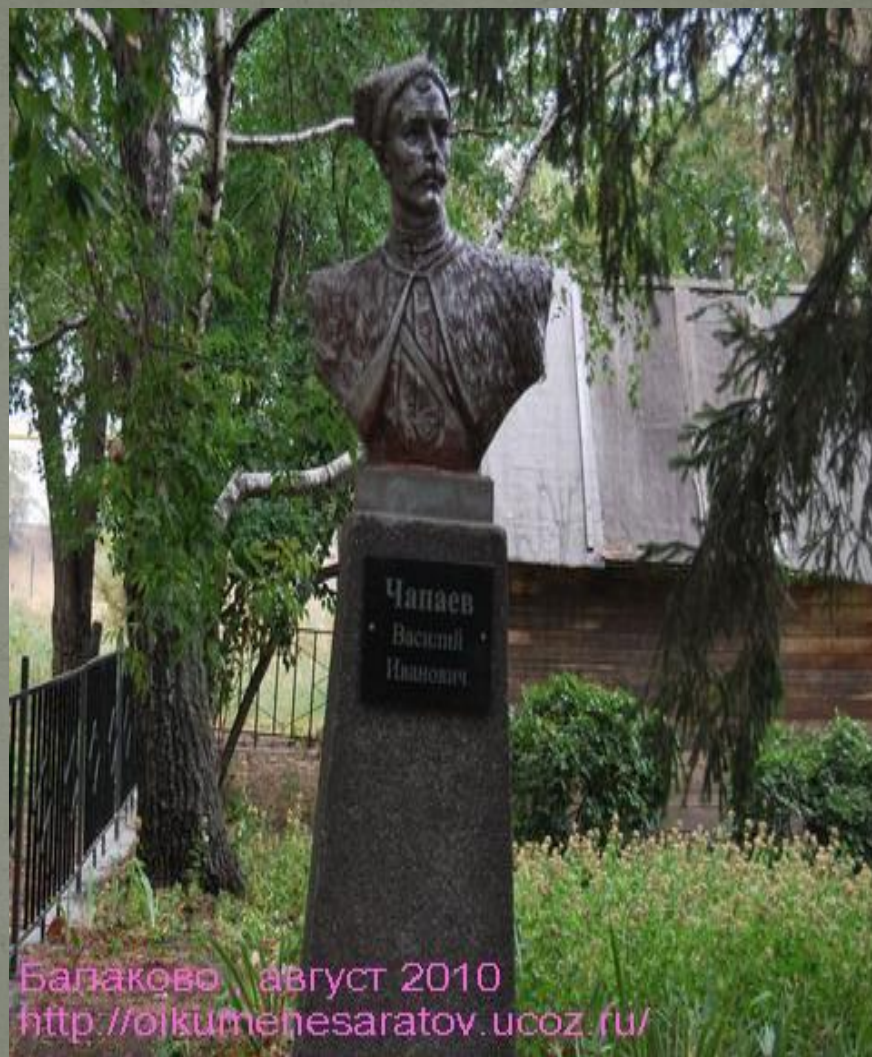
Балаково август 2010 http://oikumenesaratov.ucoz.ru/