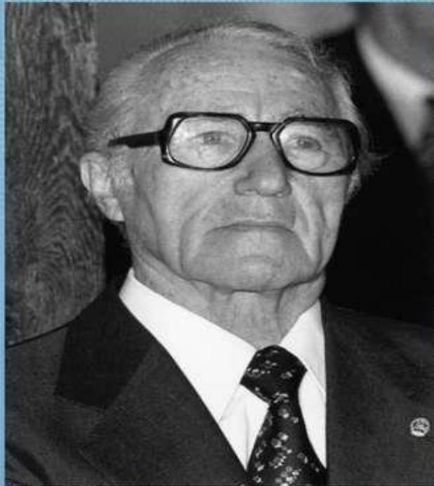
Адольф Дасслер – основатель фирмы Adidas