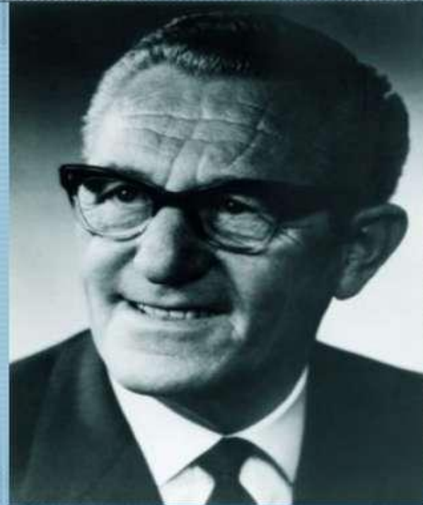
Рудольф Дасслер – основатель фирмы Puma