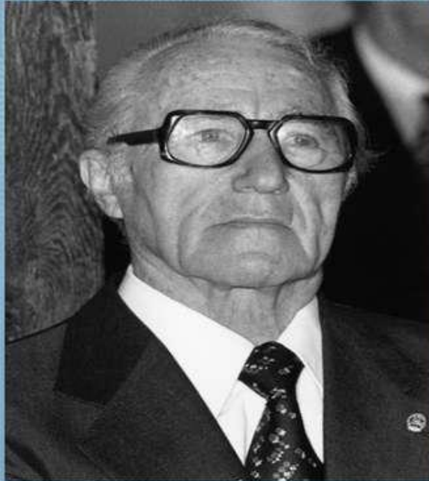
Адольф Дасслер – основатель фирмы Adidas