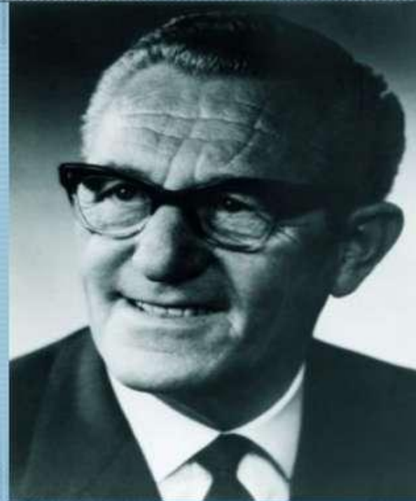
Рудольф Дасслер – основатель фирмы Puma