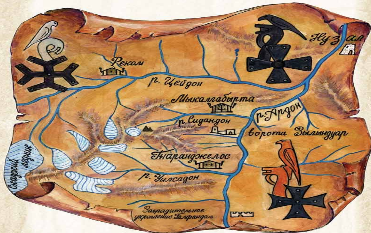
Карта расположения Трех Святаниц — Трех Слез Бога (Реком, Таранджелос, Мыкалгабырта)