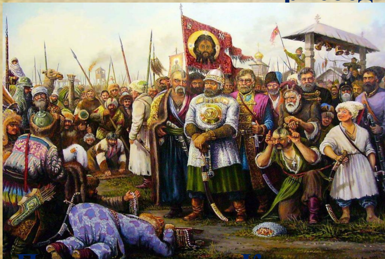
Присоединение Казанского ханства