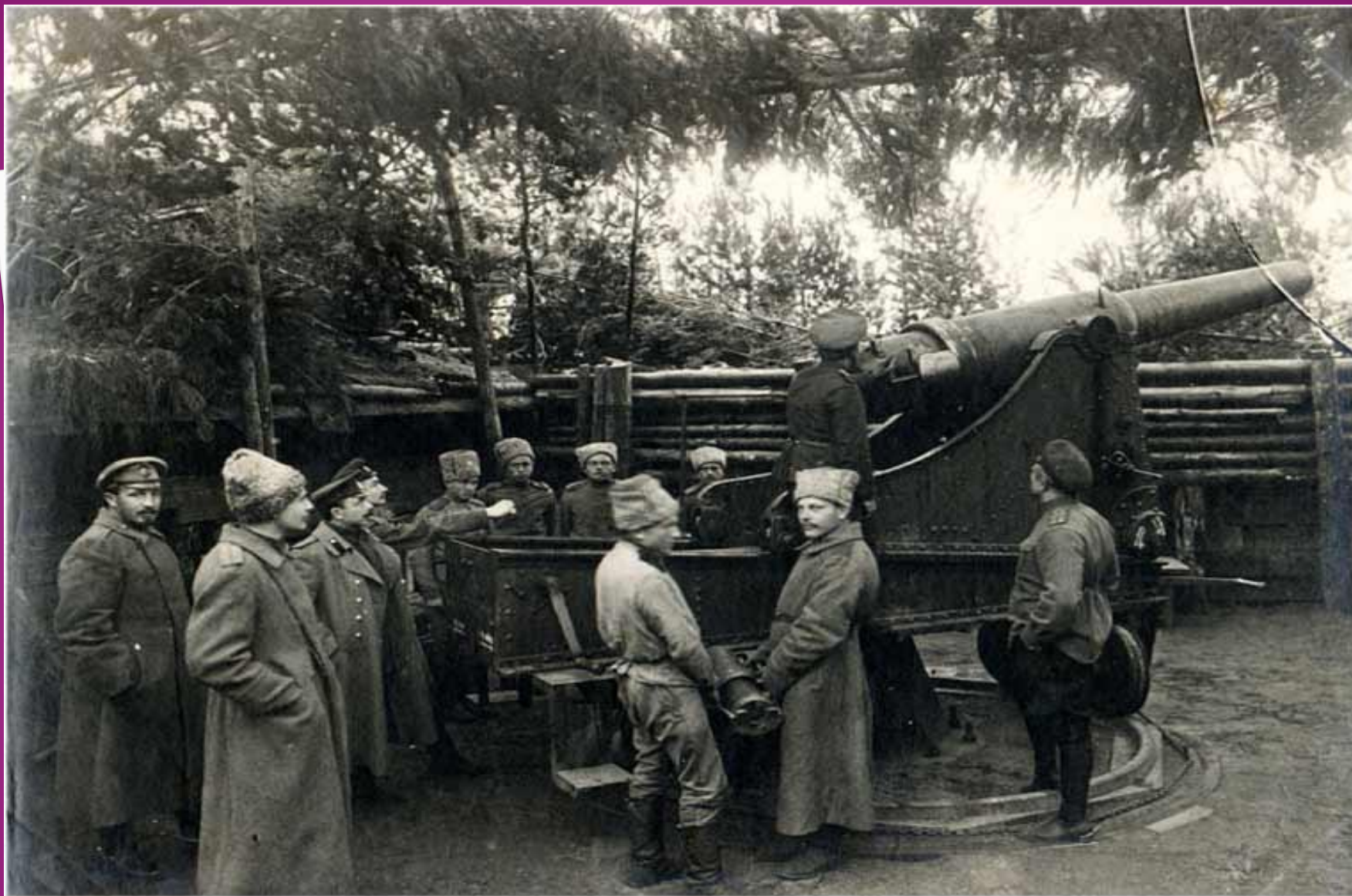
Первая мировая война. Тяжелая позиционная артиллерия. 12-й армия Северного фронта. Сентябрь 1915