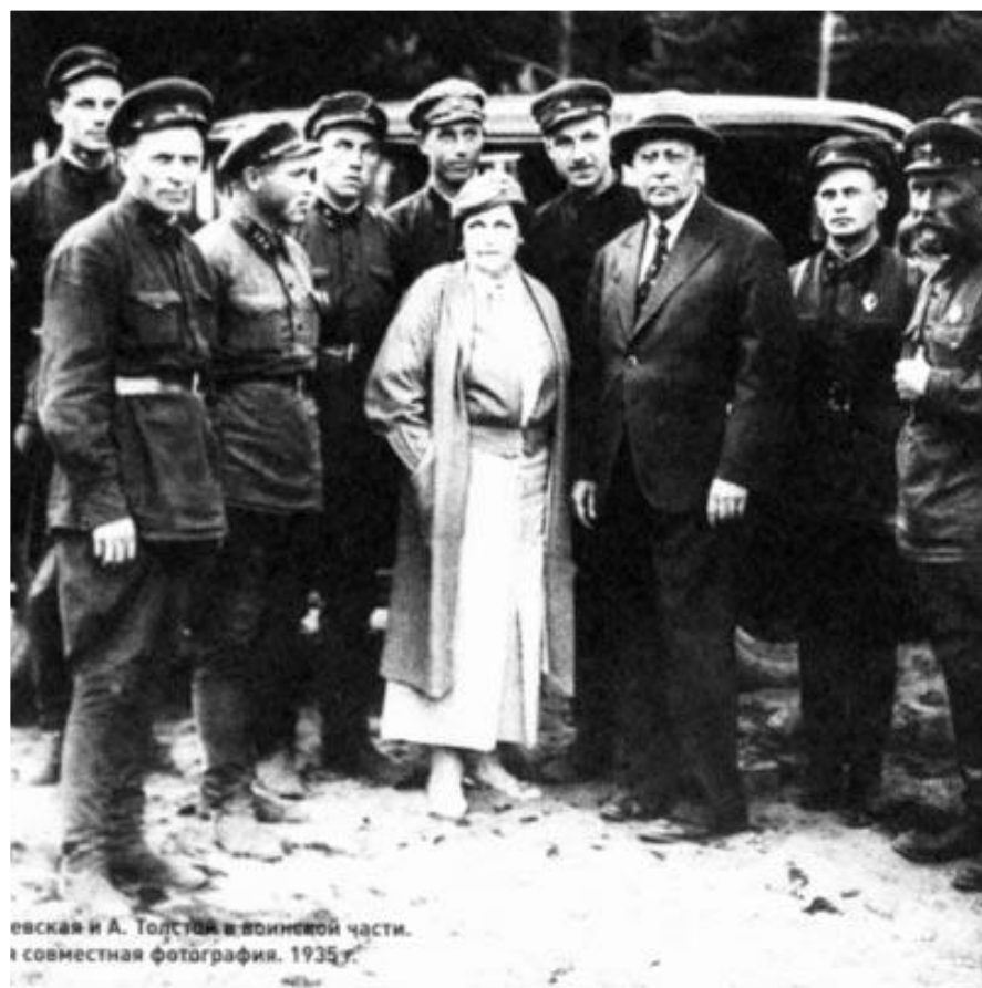
Сюсюкина и А. Толстой в воинской части. Совместная фотография. 1935 г.

ТОЛСТОЙ С ЖЕНОЙ НА ФРОНТЕ ВТОРОЙ МИРОВОЙ ВОЙНЫ.