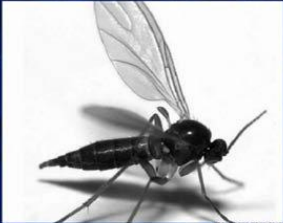
МОШКИ СЕМЕЙСТВА Simulidae (Симулиды)