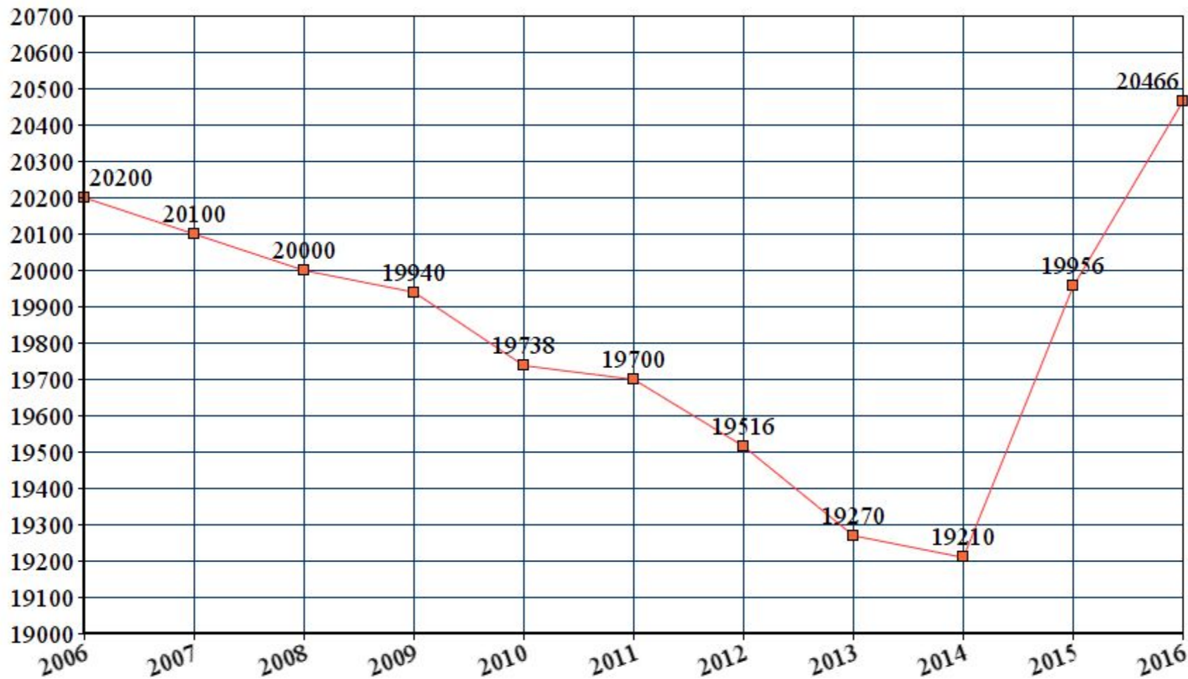
■ Изменение численности населения Боброва за последние 10 лет