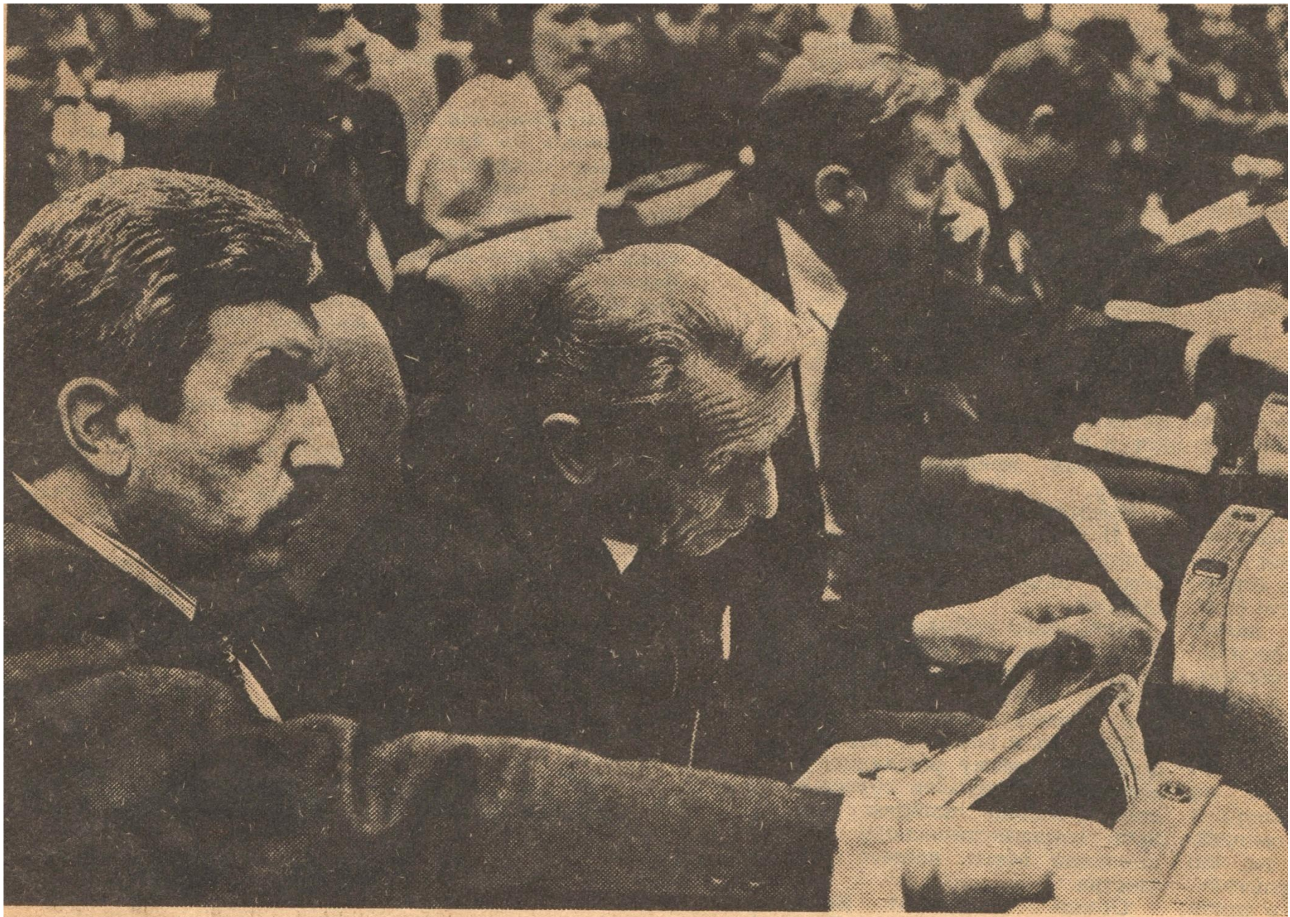
Продолжает работу IV Съезд народных депутатов СССР.