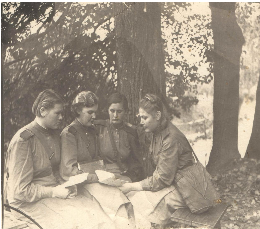
В короткие минуты отдыха