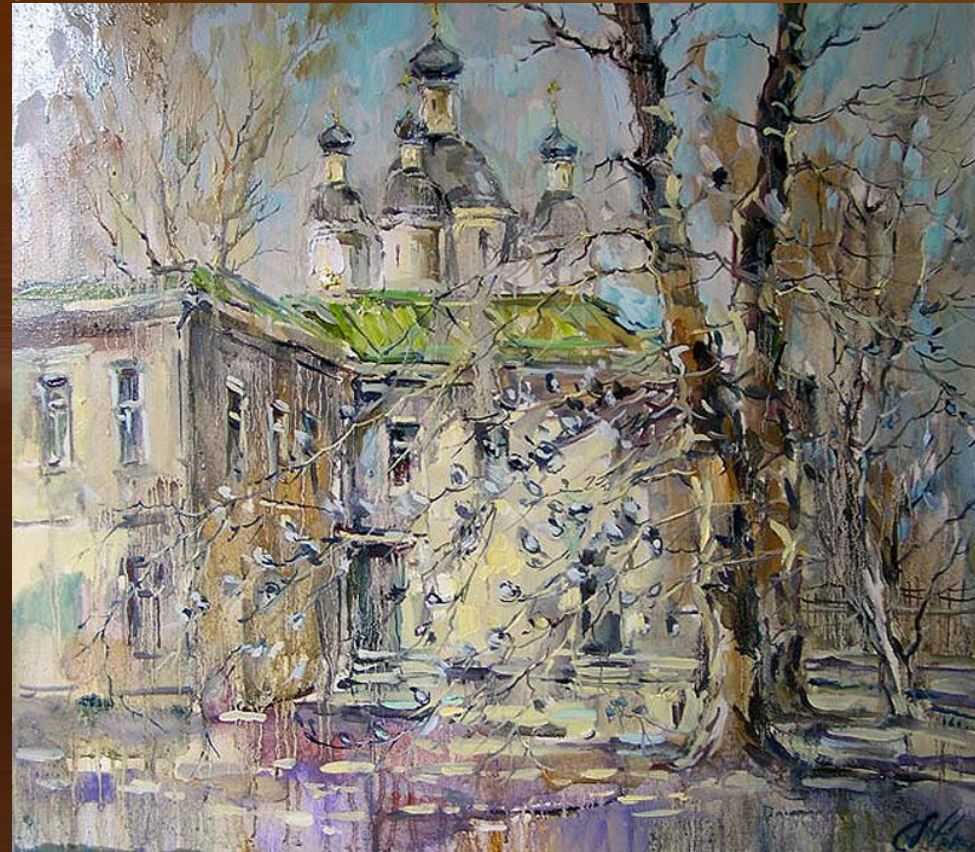
Чарина А. Вербное Воскресение. Двор на Самокатной.