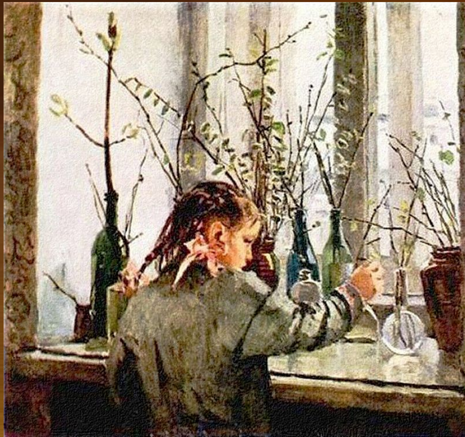
Яблонская Т. Н. За окном весна.