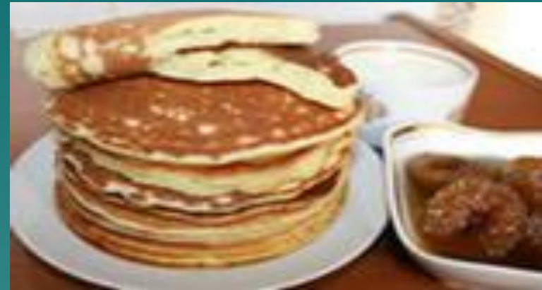
Суро ямксонь пачалксеть