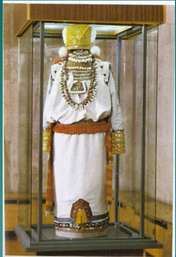
Костюм невесты эрзянки начало XX в.