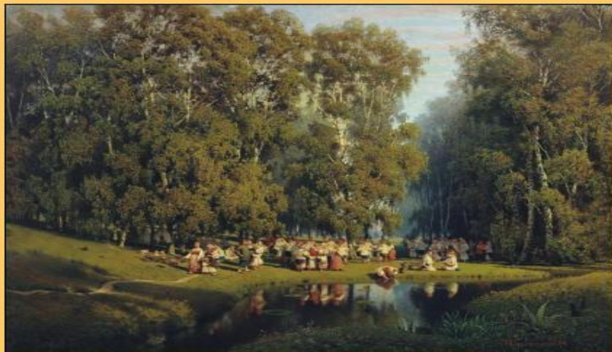
П.Суходольский. Троицын день

Троица - очень красивый праздник. Дома и храмы украшают ветками, травой, цветами. И это неслучайно. Зелень, цветы символизируют жизнь. Так люди выражают радость и благодарность Богу за то, что Он возродил их через крещение в новую жизнь.