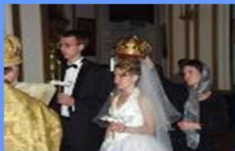
Свадьбы на Руси