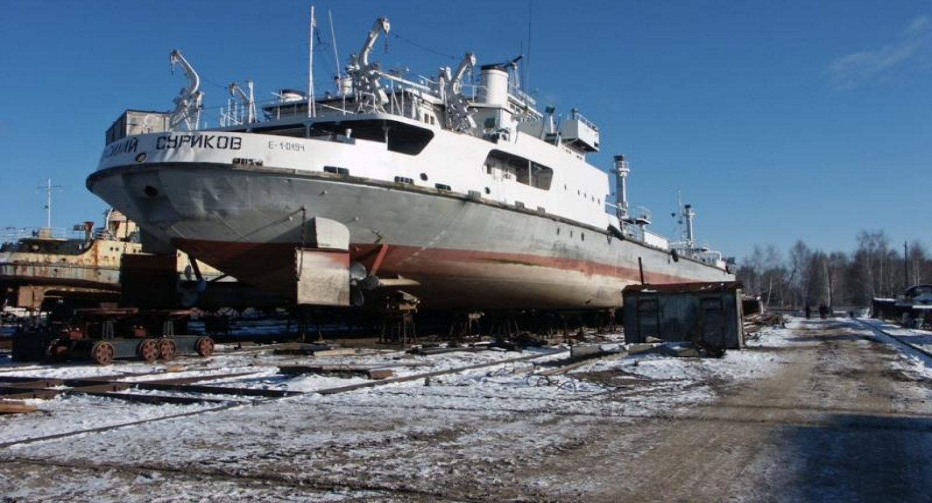
Танкер Василий Суриков