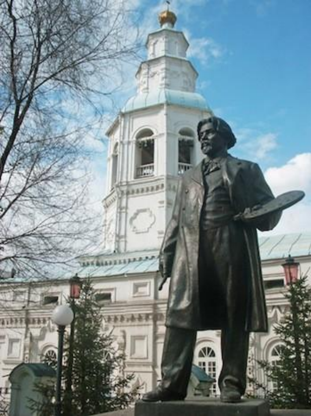
Памятник В.И. Сурикову в Красноярске