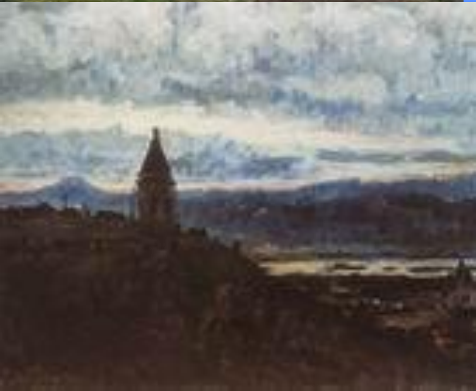
Вид Красноярска. 1887