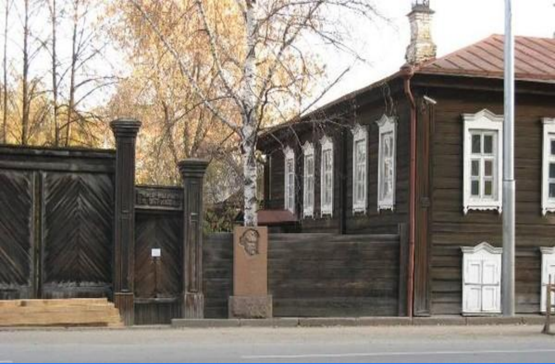
Музей-усадьба В.И. Сурикова. Красноярск