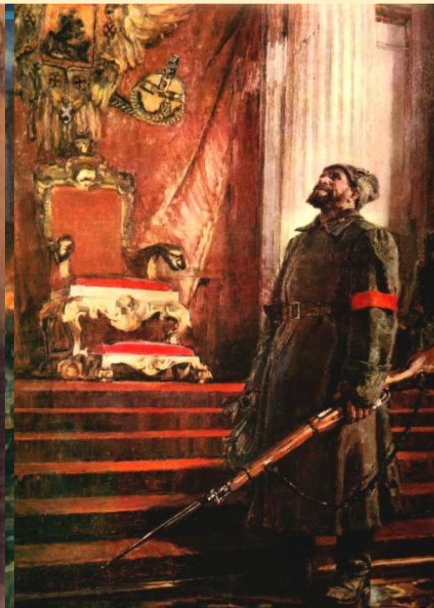
Сиг Штурм Зимний Дворца взят. Дворца Штурмом.