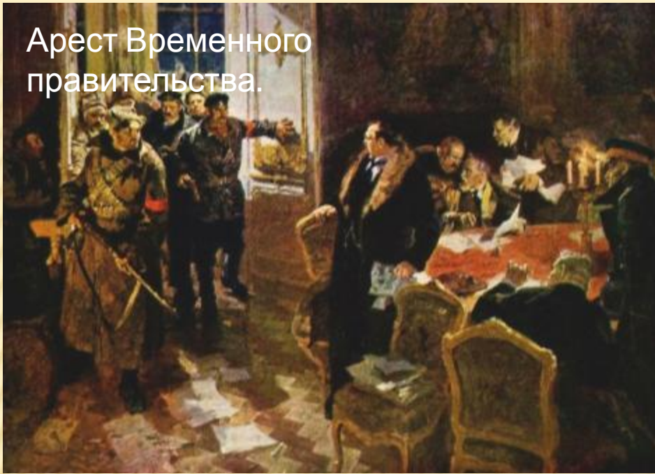
Арест Временного правительства.

Временное правительство оказалось окружённым в Зимнем дворце. Вскоре Зимний дворец был занят восставшими, а министров Временного правительства арестовали и отправили в Петропавловскую крепость.