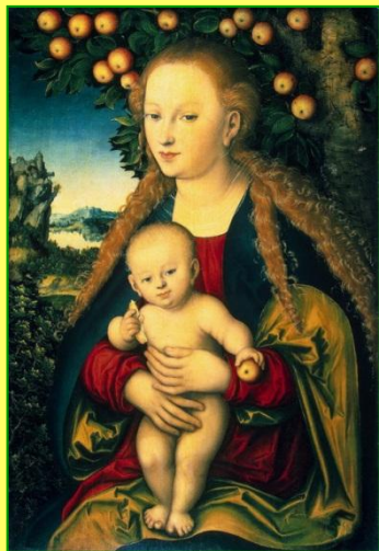
Лукас Кранех Старший «Мадонна с младенцем под яблоней»