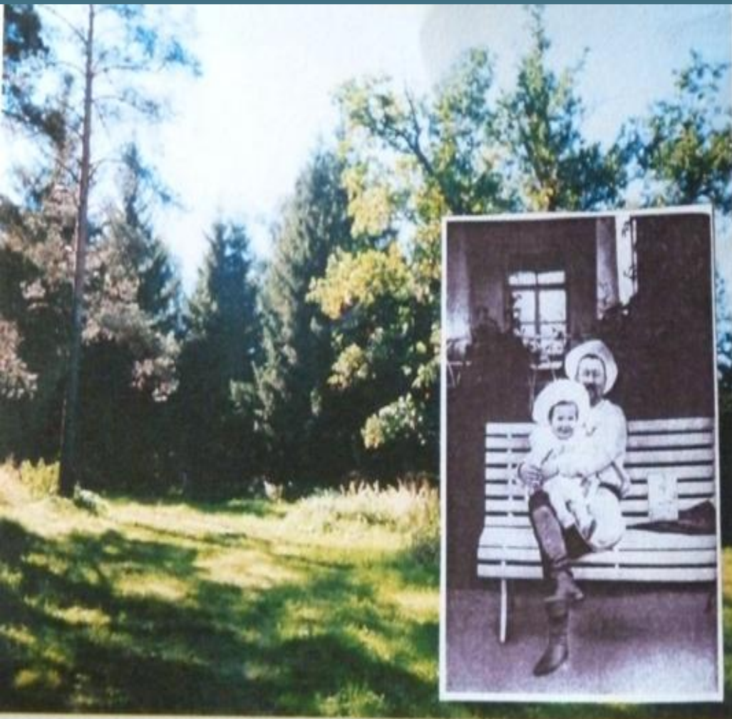
Савва Тимофеевич с маленьким Саввой в Покровском—Рубцове