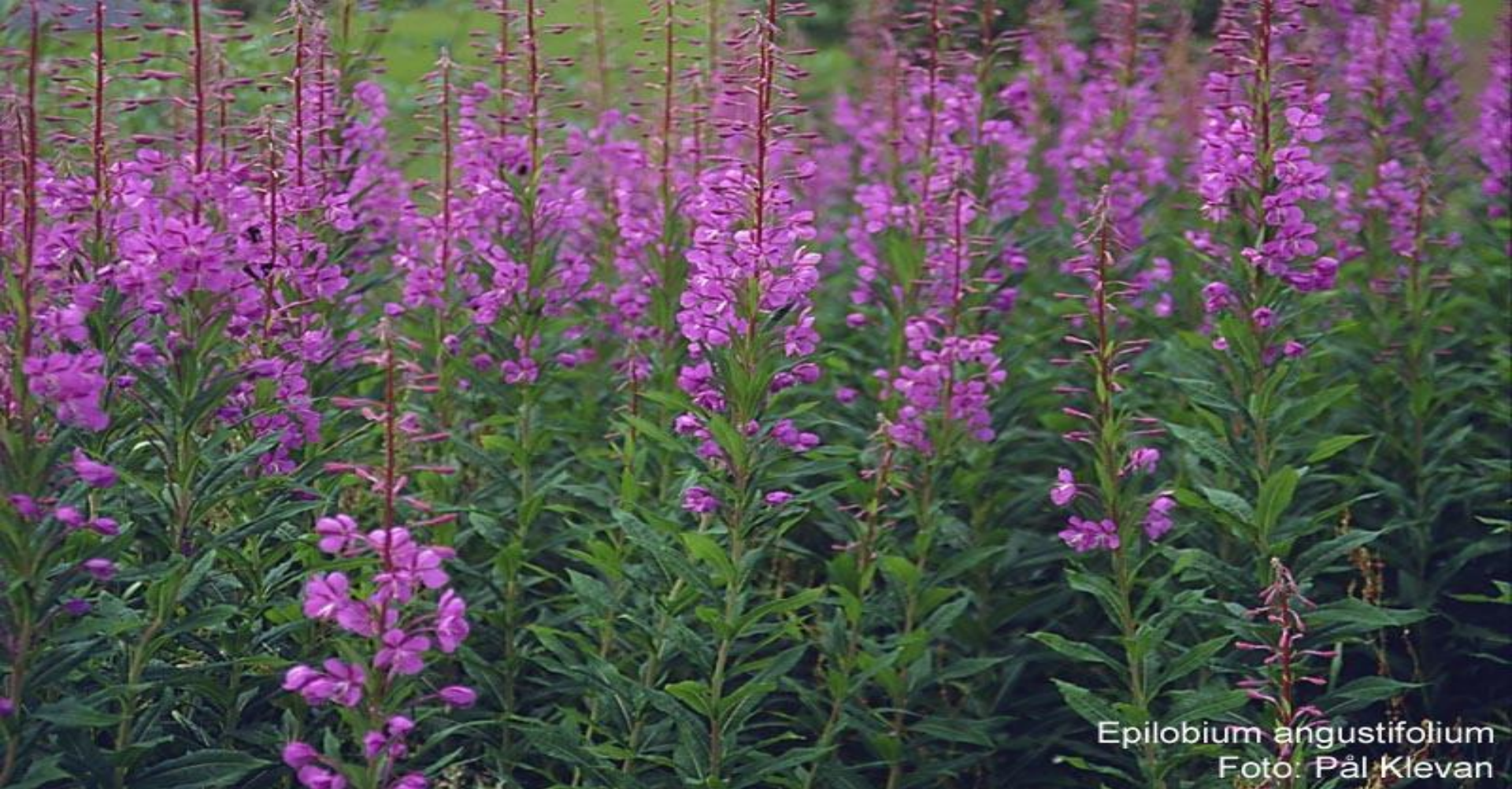
Epilobium angustifolium

Иван-чай обладает успокаивающим, спазмолитическим, противовоспалительным, ранозаживляющим, мочегонным, желчегонным, обволакивающим, мягчительным, кровоостанавливающим, обезболивающим, противоопухолевым, кроветворным свойством. Хорошее успокаивающее действие иван-чая используют в лечении бессонницы, тревожного состояния, различных форм неврозов, страхов. Противовоспалительное и обволакивающее действие эффективно в лечении заболеваний ЖКТ.